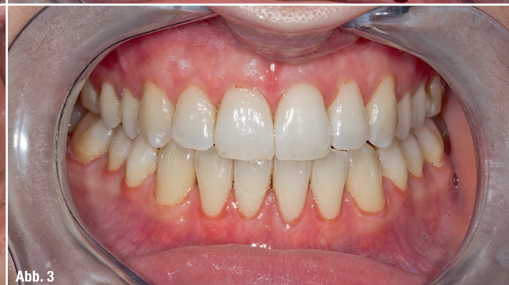
Abb. 1: Die 25-jährige Patientin mit moderater Rezession beider Kiefer und persistierenden Überempfindlichkeiten. Abb. 2a und b: Die Situation direkt nach der Operation. Abb. 3: Drei Wochen nach der Operation: Der Heilungsprozess ist gut vorangeschritten, die Löcher sind verheilt, die Morphologie der Gingiva verbessert und die Rezessionen zu 70 bis 90 Prozent gedeckt.