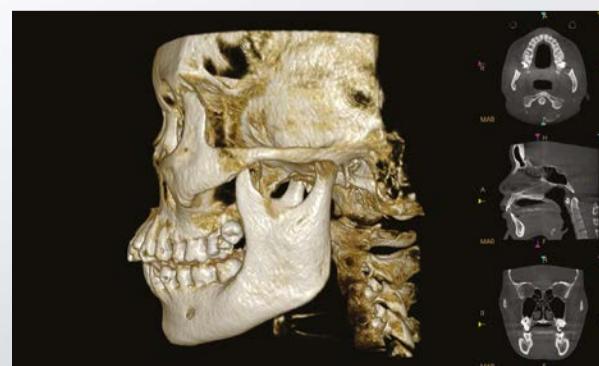
FOV 16x12 cm, igen alacsony dózissal (gyermek)