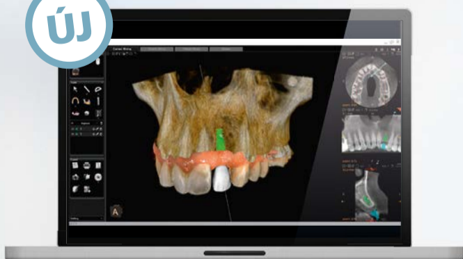
Integrált implantációs tervezés