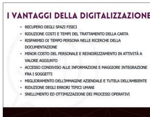
Fig. 2_ I vantaggi della digitalizzazione.

Colmare il gap tecnologico senza quello organizzativo significa rischiare di peggiorare la situazione. Ognuno ha il proprio grado di digitalizzazione e conoscenza del digitale e i vari livelli devono essere tenuti in considerazione, perché dietro allo strumento c'è sempre una persona at-