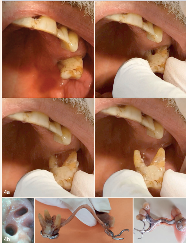
Abb. 1: Die Zunahme der gerodontologischen Behandlungen zeigt sich auch im Praxisumsatz des Autors. – Abb. 2: Darstellung der Zähne bei – oder trotz – schwerer Demenz. – Abb. 3: Ringklammer statt C-Klammer zur Verhütung von Mundwinkelverletzungen. – Abb. 4a: Der Molar lässt sich schmerzfrei aus der Alveole herausziehen und wieder zurückstecken. – Abb. 4b, links: Die Alveole des 26. – Abb. 4b, Mitte: Der 26 in der Prothesenklammer. – Abb. 4b, rechts: Der wurzellose 26 in seinem Klammerbett und in einer Sattelverlängerung einpolymerisiert.

erfolgt oft wegen einer Polypharmazie. Besonders schädlich ist eine Verschlechterung der Mundhygiene. Wenn ständig Speisereste zwischen allen Zähnen kleben, dann entsteht multiple Caries profunda wie noch nie im Leben. Der Patientenwunsch lautet normalerweise, einen Zahn nicht zu extrahieren, sondern möglichst einfach und bezahlbar zu reparieren. Dieser Wunsch ist im Alter noch bedeutungsvoller als im früheren Leben, da die sozialen Nachteile einer Zahnlücke noch schwerer wiegen. Selbst Pfleger reagieren auf Frontzahn-lücken mit weniger Zuwendung. Eines ist sicher: Der Zahnerhalt bei betagten Patienten erhöht spürbar ihre Lebensqualität, und umgekehrt ist ein enttäuschter Patient stets auch eine Last im Berufsleben des Zahnarztes.