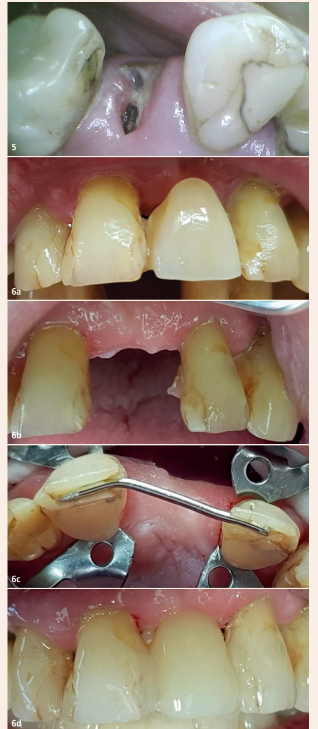
Abb. 5: Dieser Wurzelrest von Zahn 15 ist zu klein für eine Reparatur. – Abb. 6a: 2020: Flügel an 1+ gebrochen. – Abb. 6b: 2022: Beide Flügel gebrochen. – Abb. 6c: Drahtverstärkung Ø 1 mm. – Abb. 6d: Fast fertige Kompositbrücke.

Eine drahtverstärkte direkte Kompositbrücke ist robuster als e.max. Dazu wird derselbe Draht wie in Abbildung 3 verwendet. Statt 1,2 genügt ein Durchmesser von 1,0 mm, also gleich dick wie ein e.max-Flügel, aber viermal zugfester. Die Präparation der Schneidkanten ist etwa 3 mm tief und erfordert keine Anästhesie. Das