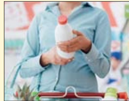
研究显示，超市售卖的包装产品中70%含有添加糖分。

这项题为《加入添加糖分提升了澳大利亚健康星级前端标签系统性能》(Incorporating added sugar improves the performance of the Health Star Rating front-of-pack labelling system in Australia) 的文章发表于Nutrients杂志。DI