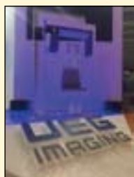
UEG能谱CBCT“视界”客户试用“视界”。

在口腔领域，UEG还将推出多款创新型的影像类产品，并通过跨模态整合，为医生提供更好的服务。DT