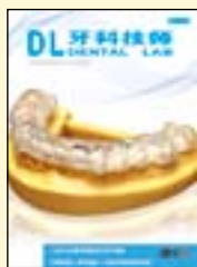
《牙科技师》 (2018年更名为《数字化牙科》)