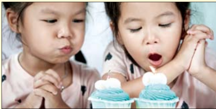
一项新研究结果表明, 与遗传因素相比, 龋齿致病菌群更易受环境因素影响。

遗传获得细菌的水平会逐渐降低, 而与环境因素相关的细菌则会增加。根据这些发现, Craig博士重申, 限制儿童摄入含糖食物和饮料, 再加上保持良好的口腔卫生习惯, 是预防龋齿的最好方法。