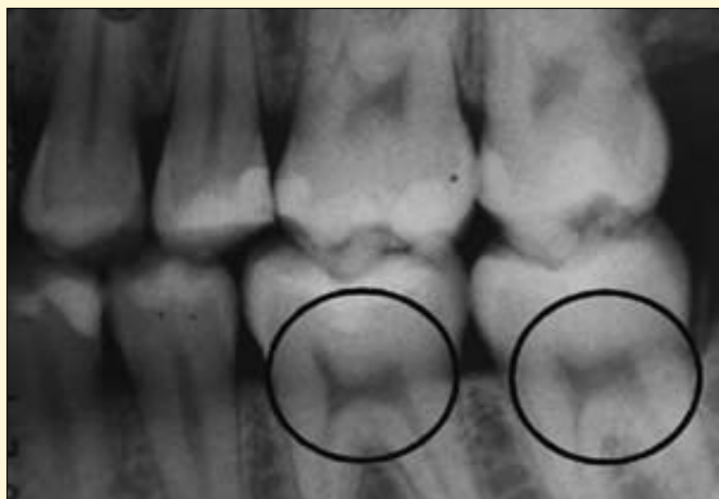
牙科X线片检测维生素D缺乏：左下颌第一磨牙和第二磨牙（黑色标记处）的牙髓形状像椅子，呈收缩角状。

被破坏，不像骨头，它们会腐烂。寻找这种畸形的问题在于，必需切开牙齿以观察形成终身维生素D记录的模式，而用于研究的尸牙的供应是有限的。