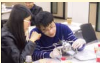
学员两两分组配对进行实操，使用殆架。