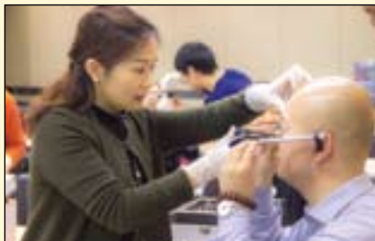
学员两两分组配对进行实操，使用殆架。