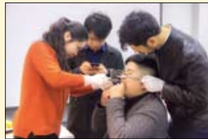
学员两两分组配对进行实操，使用殆架。