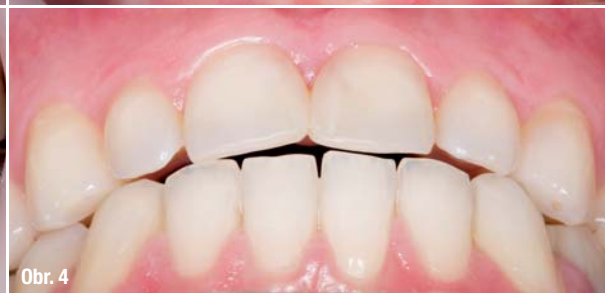
Obr. 1–4: Počáteční klinická situace