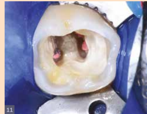
Sl. 11. Bukalne kvrčice su redukovane oko 1.5 mm kako bi se omogućila adekvatna stabilnost, kavitet je peskiran (A1203, 50 µm)

U slučaju, koji je ovde prikazan, pacijent ima veoma dubok karijes i apikalni periodontitis na zubu 36 (sl. 8.). Slika 9 pokazuje zub nakon endo tretmana i izrade privremenog ispuna. Kavitet je limitiran na okluzalnu regiju. Ipak, bukalni zid je opasno podminiran uklanjanjem karijesa, pa bukalna demarkaciona linija ide preko vrha kvrčice (sl. 10.). Iz ovog razloga, odlučio sam da redukujem vrh bukalne kvrčice, slično onlej preparaciji, te da ih zamenim kompozitom (sl. 11.). Efektivna adhezivna tehnika zahteva čist supstrat za bondiranje. Stoga je preporučivo peskirati površinu kaviteta aluminijum-trioksidom, kako bi se izbegli mogući neželjeni efekti kontaminacije NaOCl irigancijama i kanalnim punjenjima (Alshaiikh et al. 2018).