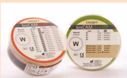
Sl. 3a: Bre.CAM HIPC i Bre.CAM BioHPP