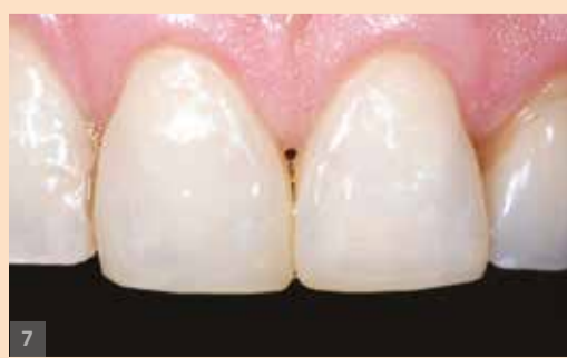
Sl. 7: Završena nadoknada sa rehidriranom zubnom strukturom. Tranzicija između zuba i nadoknade se jedino može videti na velikom uveličanju i klinički nije relevantna