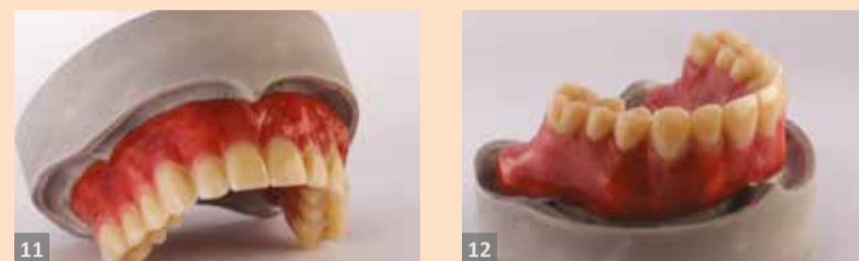
Sl. 11, 12: Konačni izgled restauracije na modelu

na nekoliko minuta ga potapamo u ultrazvučni uređaj za čišćenje. Kad završimo sa čišćenjem, ceo objekat još jednom ispoliramo svežom pamučnom četkicom bez dodatnih pasti. Krajnji izgled površine mora biti sjajan, a prelazi između kompozita i BioHPP-a glatki i ravni (sl. 7a, 7b, 7c.). Poliranje kod