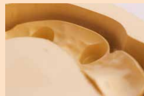
Sl. 3d: Površina BioHPP sa dobro izabranom strategijom koja ostavlja odličnu površinu