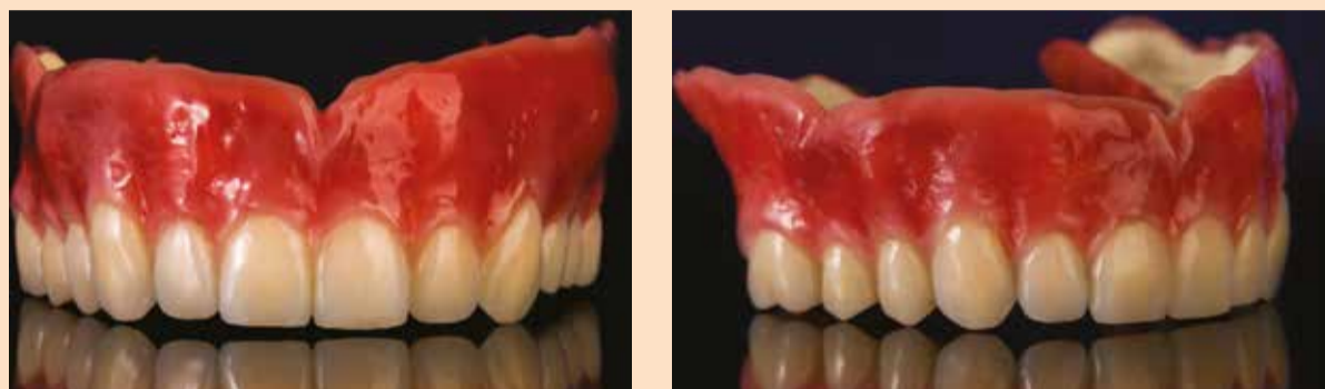
Sl. 8: Konačni izgled, nakon poliranja