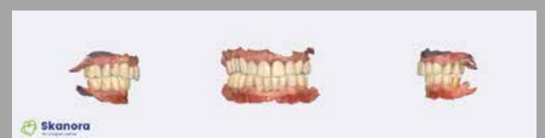
Sl. 3a: Intraoralni sken privremene mosova u ustima, zub bez krune na poziciji 35 (dr Dejan Stajčić)