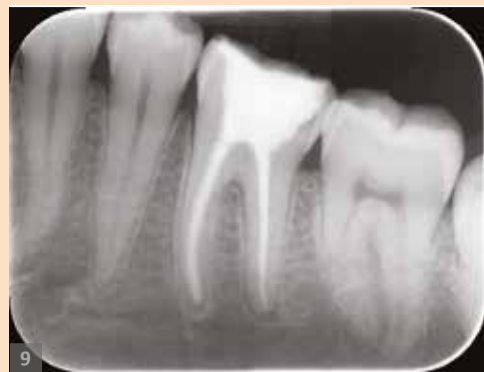
Sl. 9: Situacija nakon endodontskog tretmana i privremeni ispun