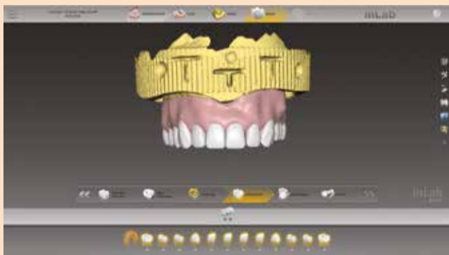
Sl. 1a: Proteza u inLab CAD programu

mo opaker u dva sloja, pri čemu koristimo Combo.lign opaker kao prvi nanos, kako bi obezbedili hemijsku vezu i Crea.lign opaker kao drugi nanos, kako bi pripremili odgovarajuću podlogu u boji. Oba nanosa polimerizujemo pod UV svetlom. Prilikom dizajna u CAD programu moramo voditi računa da obezbedimo dovoljno mesta između baze i zuba, jer bi inače posle nanošenja opakera mogli imati određene probleme. Još jednom proveravamo da li je naleganje nepromenjeno i počinjemo sa lepljenjem. BioHPP i HIPC lepimo pomoću Combo.lign lepka. Važno je da odaberemo pravilnu boju Combo.ligna, što važi i za oba nanosa opakera, jer to utiče na konačnu boju zuba. Posle lepljenja pravimo još i crvenu estetiku odnosno gingivu. Lično ja gingivu kod većih zahvata nanosim u dva koraka. U pr-