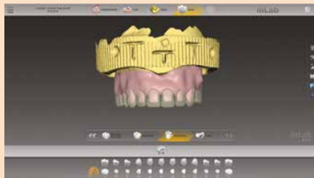
Sl. 1b: Deljenje proteze u inLab CAD programu na 2 dela