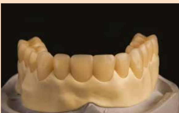
Sl. 4: Naleganje HIPC zuba na BioHPP konstrukciju