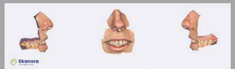
Sl. 2a: Izgled face scan-a, kod drugog pacijenta (dr Dejan Stajčić)