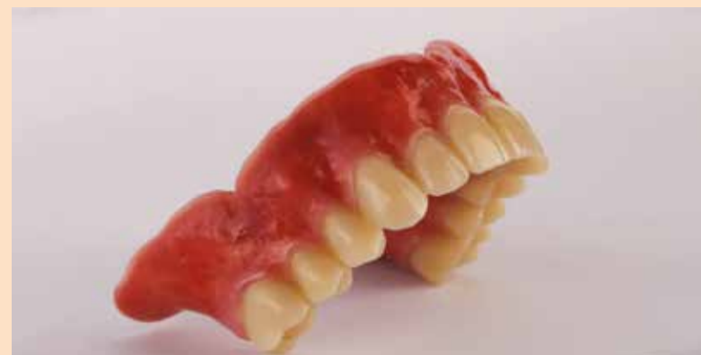
Sl. 10: Izvanredna makro i mikro struktura

i bakterije, jer ćemo samo na takav način moći da obezbedimo pravilnu biokompatibilnost materijala u usnoj duplji. Kad smo zadovoljni sa ispoliranom površinom našeg objekta, treba da ga isperemo tečnom vodom, četkicom i sapunom i