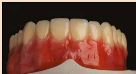
Sl. 6b: Korišćenje Visio.Paint seta boja za karakterizaciju kompozitnih zuba

predpripreme oba dela zajedno sa modelom stavimo u gipsani element za podlaganje proteza (sl. 5.). Tako kod lepljenja oba dela ne dolazi do bilo kakvih pomeranja, što bi negativno uticalo na okluziju i funkciju restauracije. Kad BioHPP presujemo, možemo naneti retencije, što je onemogućeno kod glodanja, zato posle livenja u gipsu pomoću burgije pripremamo površinu, kako bi ona bila hrapava i donekle izbrazdana. Površinu baze i unutrašnjost zuba u potpunosti ispeskarimo sa 110gm aluminijum oksidom i izduvamo vazduhom. Nikako ne ispiramo vodom ili parnim čistačem, jer time sprečavamo dobro vezivanje između površine i prajmera. Za BioHPP i HIPC koristimo prajmer Visio.link i posle nanošenja ga polimerizujemo pod UV svetlom 90 sekundi. Posle nanošenja prajmera na bazu nanosi-