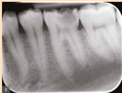
Sl. 8: Radiološka preoperativna situacija za zubu 36: duboki karijes okluzalne površine i apikalni periodontitis