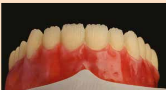
Sl. 6a: Cut-Back HIPC zuba