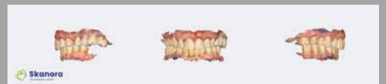
Sl. 1a: Intraoralni sken inicijalnog stanja pacijenta (dr Dejan Stajčić)