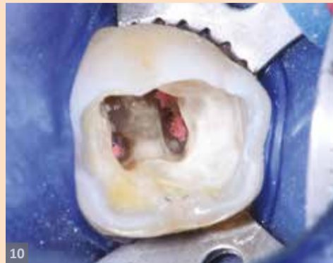
Sl. 10. Situacija pre nanošenja kompozita. Kanalno punjenje je redukovano na nivo ispod otvora kanala