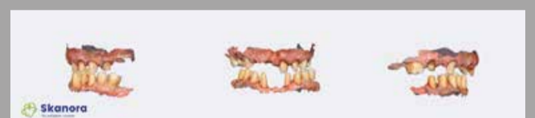
Sl. 2: Intraoralni sken za izradu privremenih mostova (dr Dejan Stajčić)