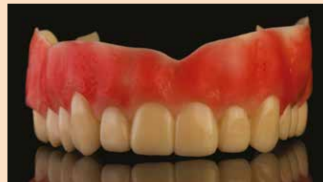
Sl. 2: 3D print za proveru funkcije, okluzije i estetike