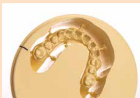
Sl. 3b: Izrezana BioHPP baza