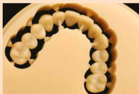
Sl. 3c: Rezane HIPC krune