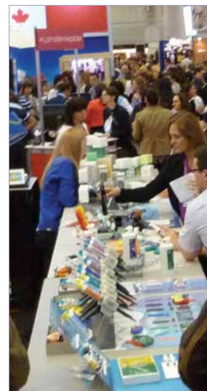
• Le hall d'exposition est ouvert aujourd'hui de 8 h à 18 h et demain de 8 h à 17 h.

You can download the free JDIQ 2018 app to your smartphone or tablet via the App Store or Google Play. Or you can access the app on the meeting website,