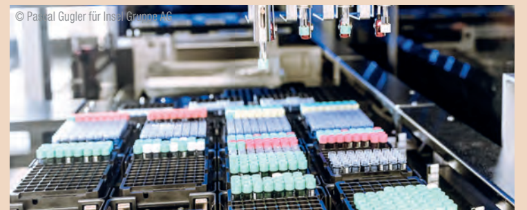
Zum Netzwerk des BCPM gehört auch die hochmoderne Infrastruktur der Liquid Biobank am Inselspital. Ihre Sammlung aus biologischen Flüssigproben soll die Präzisionsmedizin am Standort Bern mit vorantreiben.