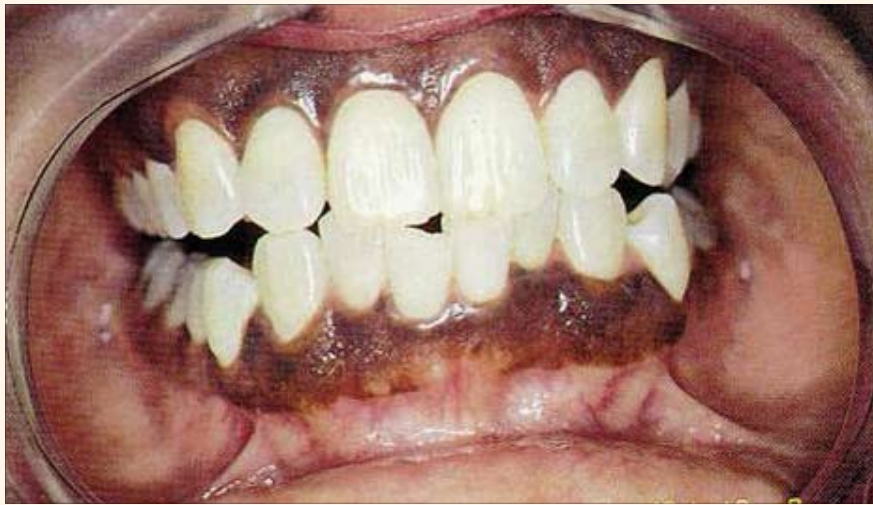
Resultados en la despigmentación causada por melanosis