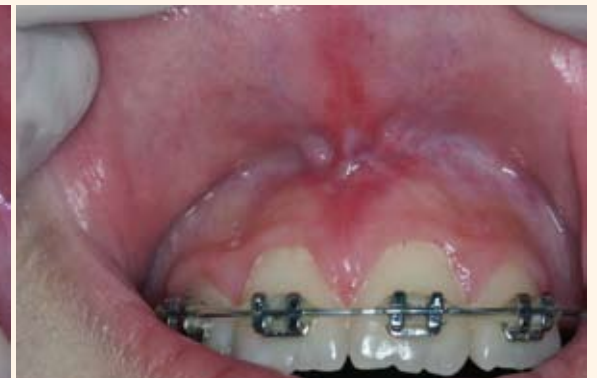
Tratamiento de la frenectomía con láser