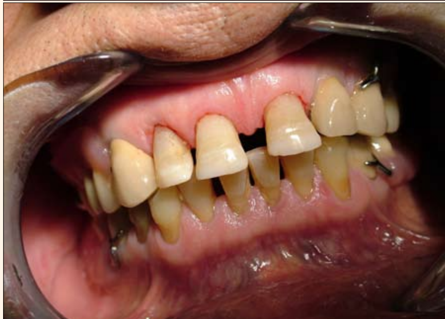
Caries en la región cervical de la zona frontal.

Como no se requiere anestesia, muchos de los tratamientos de caries pueden finalizarse en el tiempo que tradicionalmente tomaba el proceso de anestesiarse al paciente. Actualmente las potencias disponibles son también el doble de lo que originalmente se ofrecía, aumentando así también su rendimiento.