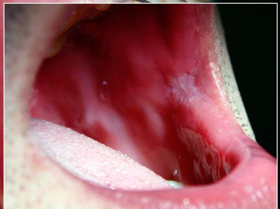
Fibromas antes y después

Los tratamientos menos invasivos, indoloros y con postoperatorios breves son hoy en día el estándar de una práctica exitosa.