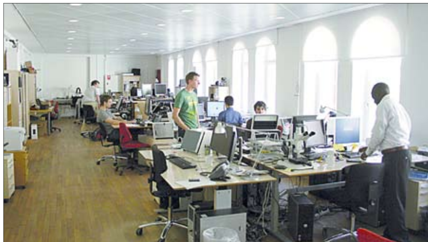
La luminosa sede de 3Shape en Copenhague.