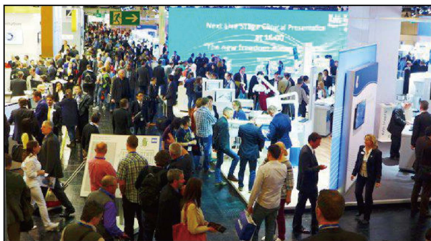
●預計將有超過2200名牙科工業代表參加2017年科隆國際牙科展(IDS 2017)

在2017年的科隆國際牙科展(IDS)期間,世界牙科論壇(DTI)將繼續向全球讀者提供來自展會的時訊。除了《今日》展會特刊(Today)以外,世界牙科論壇(DTI)還會向全球訂閱用戶提供電子通訊服務。有意通過世界牙科論壇(DTI)媒體產品宣傳2017年科隆展產品的參展商可參閱世界牙科論壇(DTI)在2017年科隆展(IDS 2017)上的出版產品名冊(DTI Media Kit),或直接諮詢世界牙科論壇(DTI)銷售團隊。