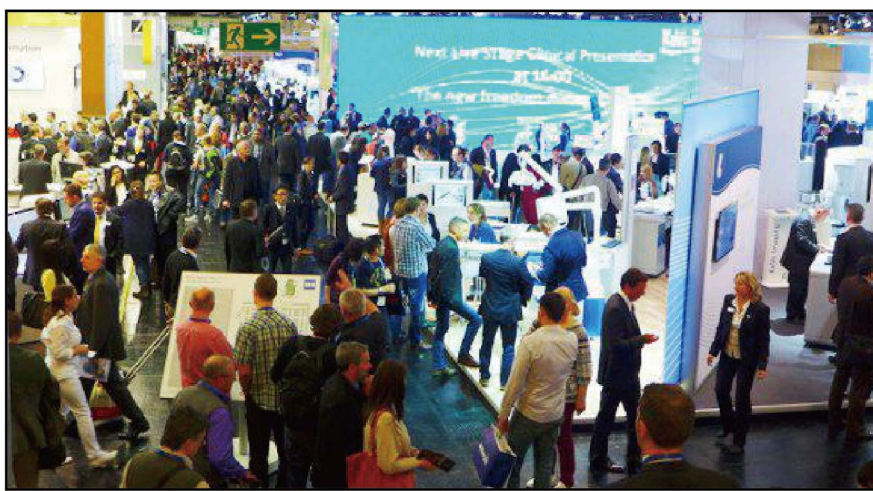
●預計將有超過2200名牙科工業代表參加2017年科隆國際牙科展(IDS 2017)

在2017年的科隆國際牙科展(IDS)期間,世界牙科論壇(DTI)將繼續向全球讀者提供來自展會的時訊。除了《今日》展會特刊(Today)以外,世界牙科論壇(DTI)還會向全球訂閱用戶提供電子通訊服務。有意通過世界牙科論壇(DTI)媒體產品宣傳2017年科隆展產品的參展商可參閱世界牙科論壇(DTI)在2017年科隆展(IDS 2017)上的出版產品名冊(DTI Media Kit),或直接諮詢世界牙科論壇(DTI)銷售團隊。