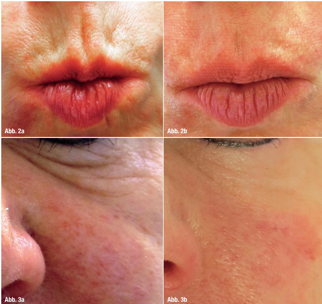
Abb. 2a und b: Maximale Anspannung des M. orbicularis oris vor der Behandlung (a), versuchte maximale Anspannung nach dem Einbringen von fünf Basic-Fäden auf jeder Seite (horizontal) (b).* Abb. 3a und b: Vor (a) und nach dem Einbringen (b) von 0,2ml Filler und 10 Basic-Fäden in Criss-Cross-Technik.*

Jahre auch gut dokumentiert. Die Fäden werden in tiefer liegende Hautbereiche platziert. Dort initiieren sie eine Fremdkörperreaktion. Der PDO-Faden wird daraufhin durch Bio-Stimulation mit Kollagenfasern ummantelt. In diesem Zusammenhang kommt es auch zu einer Regeneration im Gewebe durch eine Verbesserung des Zellmetabolismus und der Durchblutung durch das Einsprossen neuer Gefäße. Für die verschiedenen Einsatzbereiche und die unterschiedlichen Hauttypen stehen uns PDO-Fäden unterschiedlicher Dicke und Struktur zur Verfügung. Der variable Einsatz erlaubt individuelle zielorientierte Anwendungskombinationen.