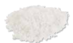
CANCELLOUS PARTICULATE Mineralized