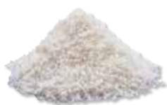
CORTICAL PARTICULATE Mineralized (FDBA)