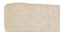
ORACELL Ακύτταρο αλλόδερμα για ανάπλαση μαλακών ιστών (Ουλοπλαστική)