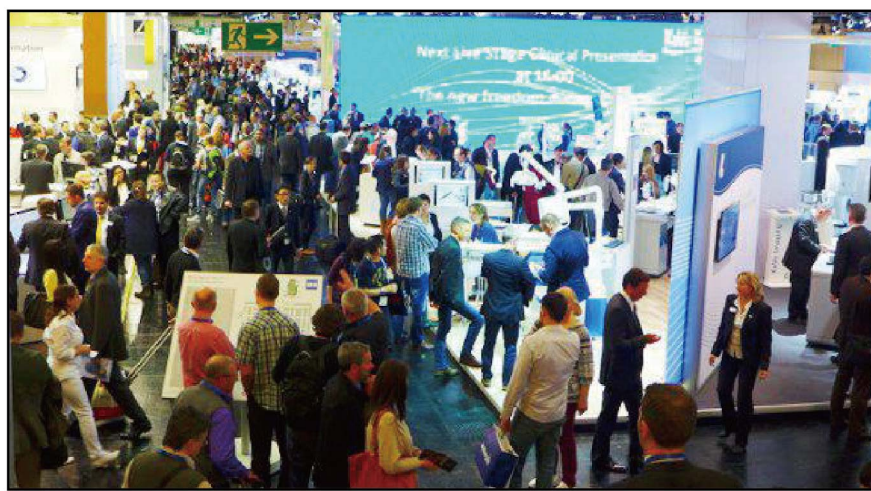
●预计将有超过2200名牙科工业代表参加2017年科隆国际牙科展(IDS 2017)

在2017年的科隆国际牙科展(IDS)期间,世界牙科论坛(DTI)将继续向全球读者提供来自展会的时讯。除了《今日》展会特刊(Today)以外,世界牙科论坛(DTI)还会向全球订阅用户提供电子通讯服务。有意通过世界牙科论坛(DTI)媒体产品宣传2017年科隆展产品的参展商可参阅世界牙科论坛(DTI)在2017年科隆展(IDS 2017)上的出版产品名册(DTI Media Kit),或直接咨询世界牙科论坛(DTI)销售团队。