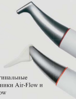
> Оригинальные наконечники Air-Flow и Perio-Flow

Эффективное удаление биопленки в глубоких пародонтальных карманах. Это сущность Оригинальной Технологии Air-Flow Perio. Сокращение уровня поддесневых бактерий предотвращает потерю зуба (пародонтит) или потерю имплантата (периимплантит). Равномерный турбулентный поток воздушно-порошковой смеси и воды предотвращает эмфизему мягких тканей, даже за пределами традиционной области профилактики, благодаря действию носика Perio-Flow.