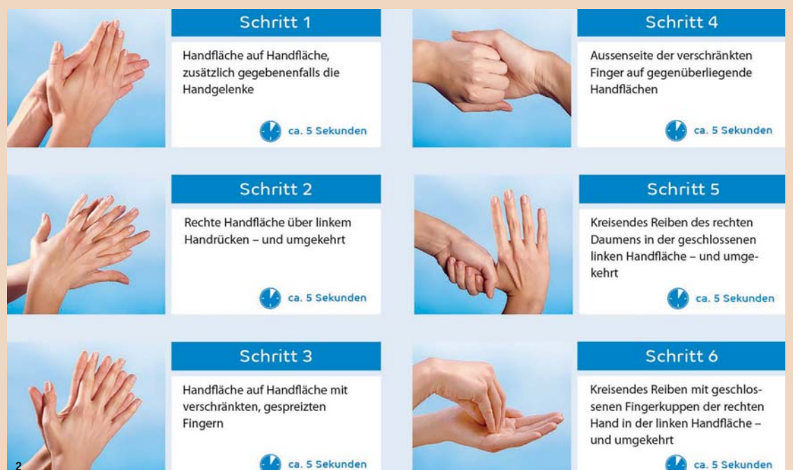
Abb. 2: Sechs Schritte der Händedesinfektion.

Maximale Infektionsprävention hat allerhöchsten Stellenwert, um sowohl Patienten als auch Personal zu schützen. Untersuchungen zeigen, dass Mikroorganismen, wie Staphylococcus aureus (und dessen resistente Variante MRSA), ohne ausreichende Dekontaminationsmassnahmen bis zu mehreren Monaten auf unbelebten Flächen noch nachgewiesen werden konnten. Influenzaviren werden durch Tröpfchen- und Schmierinfektion übertragen. Bakterien und Viren können zum Beispiel über mehrere Tage an Oberflächen und Türgriffen, Treppengeländern oder Ge-