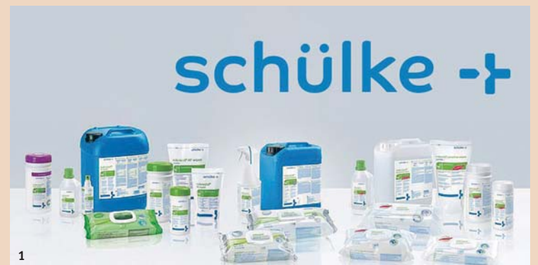
Abb. 1: mikroZID® Familie.

Alle Mitarbeiter einer Zahnarztpraxis sind vom Praxisinhaber oder Hygieneverantwortlichen nachweislich über potenzielle Infektionsquellen, Infektionswege und erforderliche Sicherheitsmassnahmen