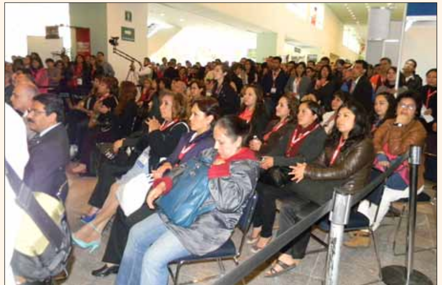
Público durante la inauguración de la exposición comercial.