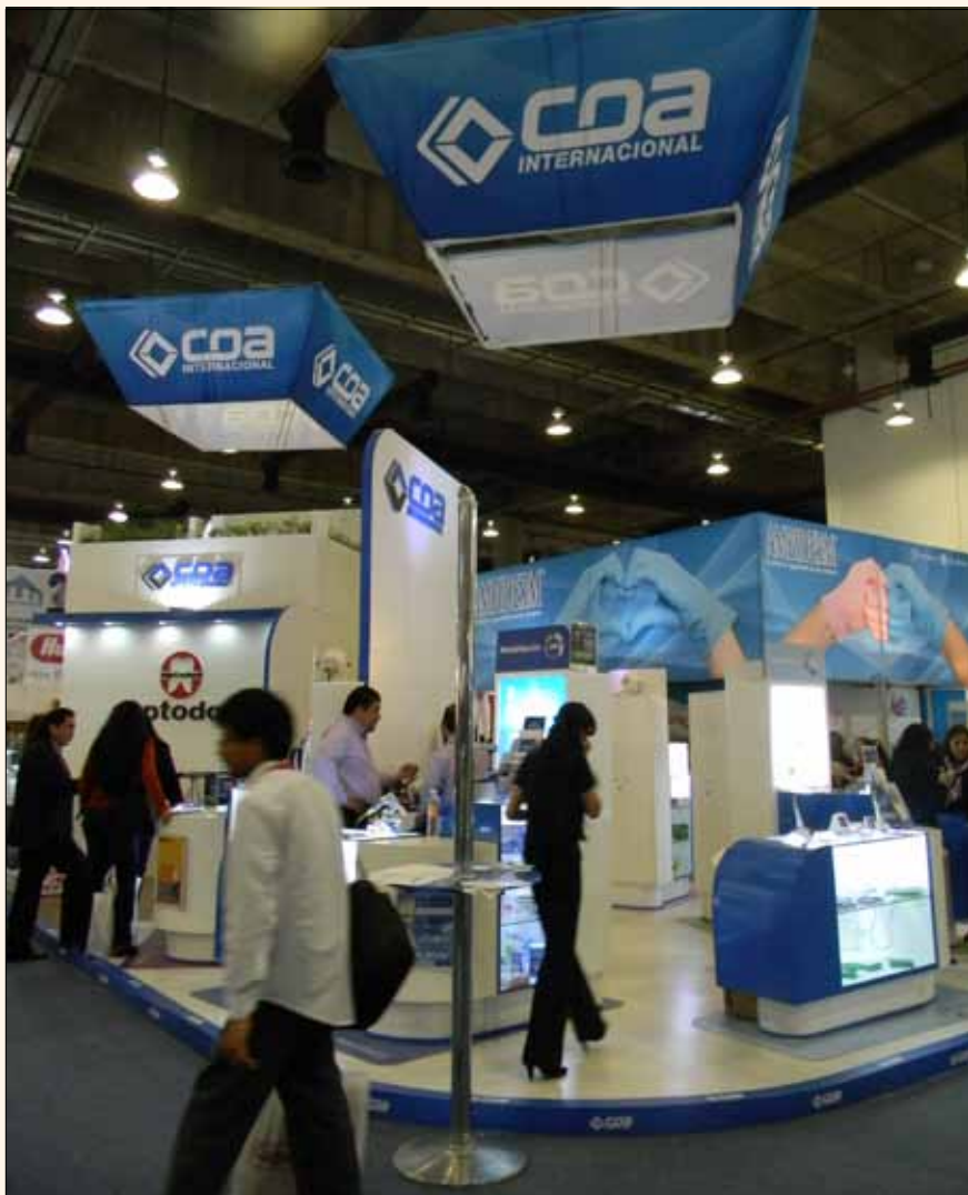
COA Internacional distribuye productos como los anestésicos de Septodont.