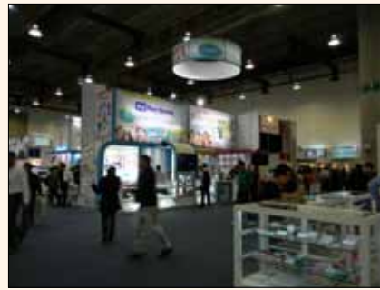
Vista de la feria comercial.