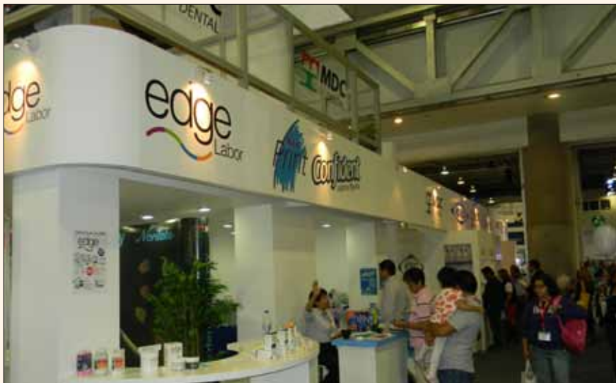
El stand de MDC en la feria de México.