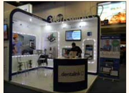
El stand de dentalink.