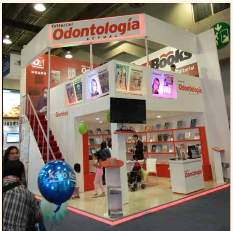
El stand de dos pisos de Odontología Actual.