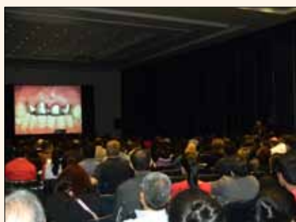
Uno de los cursos durante el congreso internacional de ADM.