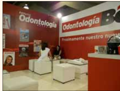
La parte superior del stand de Odontología Actual.