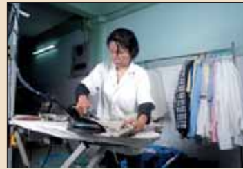
亚洲数百万女性在国外受雇为家政从业人员。

报告陈述道：“由于发达国家家政服务需求迅速增长，欠发达地区劳动力向先进经济体地区流动只会呈现增长态势。考虑到外佣通过国外汇款对经济做出的重要贡献，扮演着非常关键的经济角色，劳力输出国是简化迁移流程的既得利益者。因此，确保外佣的安全和健康对雇佣及劳动力输出国都