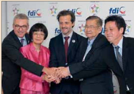
FDI与泰国牙科协会将共同举办2015年年会。