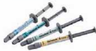
Variolink ® N 多功能美学树脂水门汀