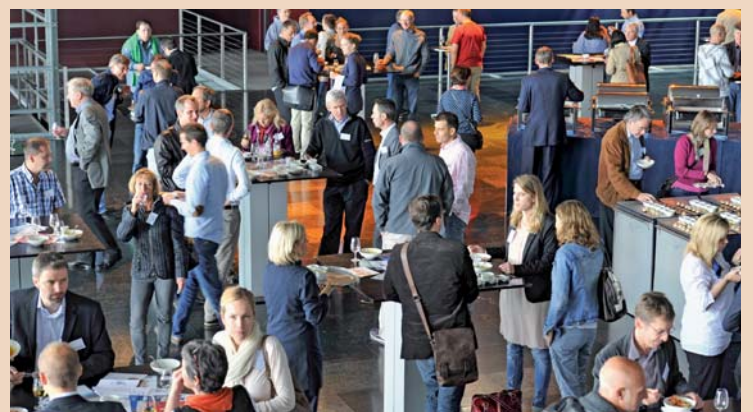
150 Teilnehmer fanden sich am 25. und 26. Mai zum Schmerz-Update im KKL Luzern ein.