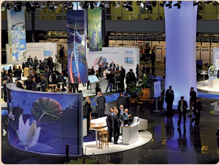
Die Ausstellung wurde als Quelle der Inspiration gestaltet, die Themeninseln durch angelegte Wasserläufe verbunden.

Überlebensraten der ersten Implantate lagen nur bei ungefähr 50 Prozent. Die anfängliche Skepsis der schwedischen Zahnärzte liess sich