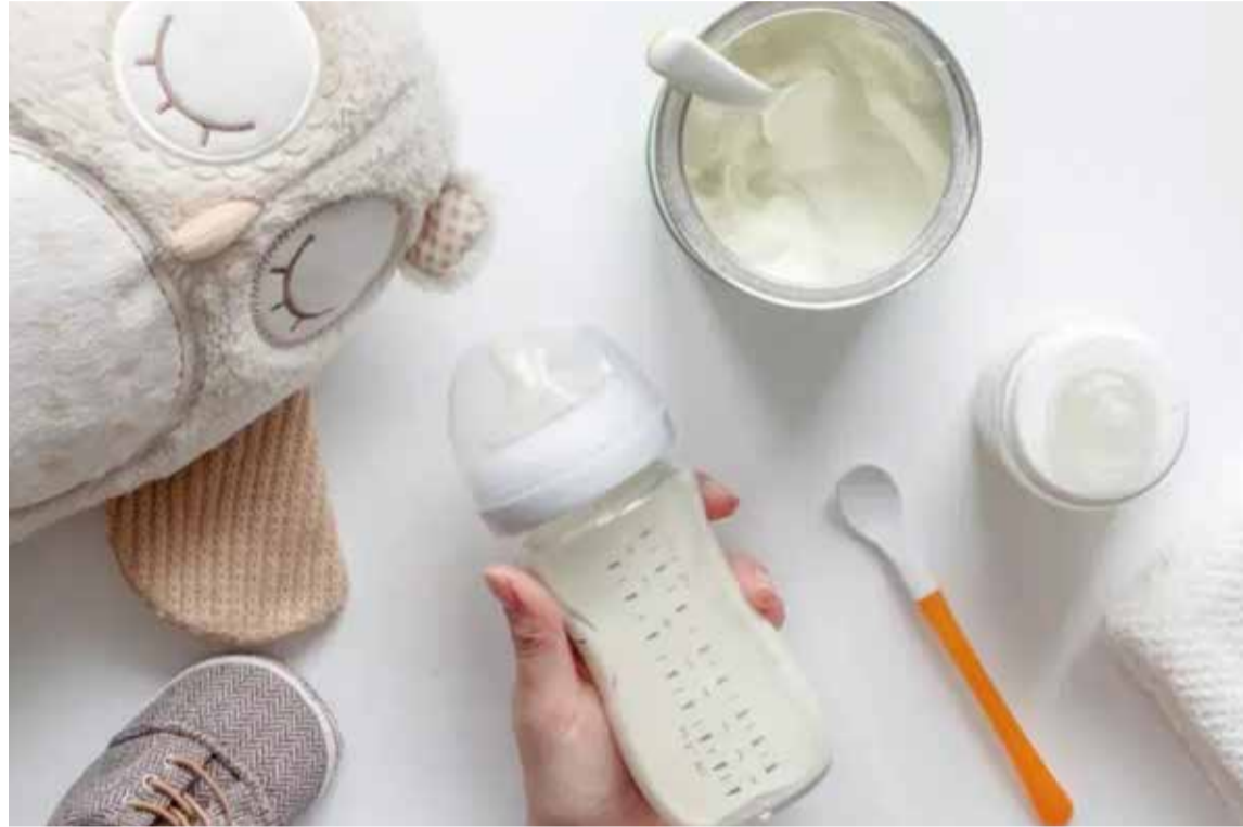
Nedavno objavljeno istraživanje pokazalo je da trećina brandova hrane za dojenčad u UAE-u sadrži mjerljivu razinu šećera, što bi moglo utjecati na zdravlje dječjih zubi.

zine glukoze, fruktoze i saharoze u 71 brandu hrane za dojenčad koja se prodaje u UAE-u kao i za djecu u dobi od 1 do 3 godine. Nakon analize podataka otkrili su da najmanje 23 uzorka sadrže mjerljive razine šećera. Osim toga, šećeri u deset uzoraka kretali su se između 5,68% i 27,06%, čime su premašili 5,0% ukupnog unosa energije. Svjetska zdravstvena organizacija preporučuje da manje od 10% ukupnog unosa energije treba doći iz šećera i navodi da bi daljnje smanjenje na ispod 5% moglo imati dodatne zdravstvene koristi.