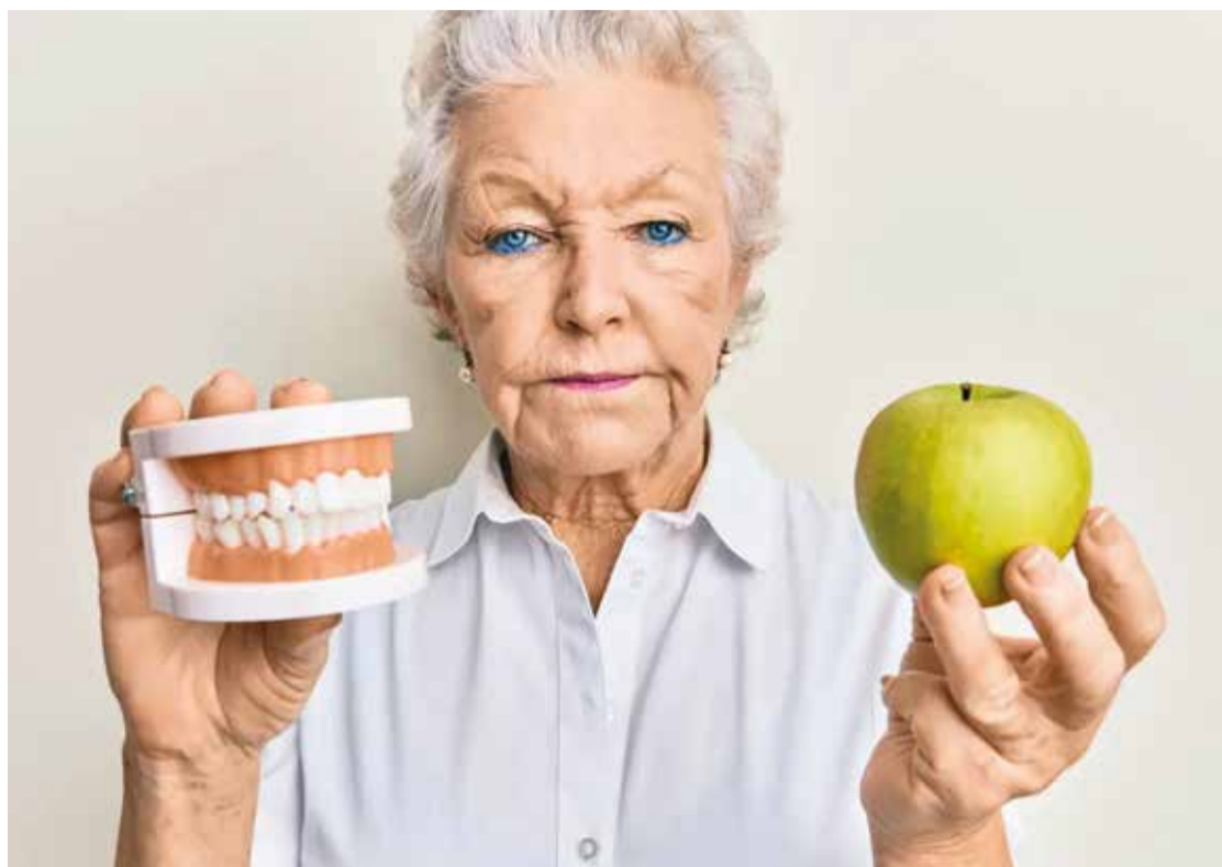
Retrospektivna longitudinalna studija koju su proveli Institut Regenstrief i Stomatološki fakultet Sveučilišta Indiana pokazuje da bi osobe s totalnim i djelomičnim protezama mogli biti izloženi riziku od nutritivnih nedostataka.

Proteze su značajna promjena za osobu. Oni ne pružaju istu učinkovitost žvakanja, što može promijeniti prehrambene navike.