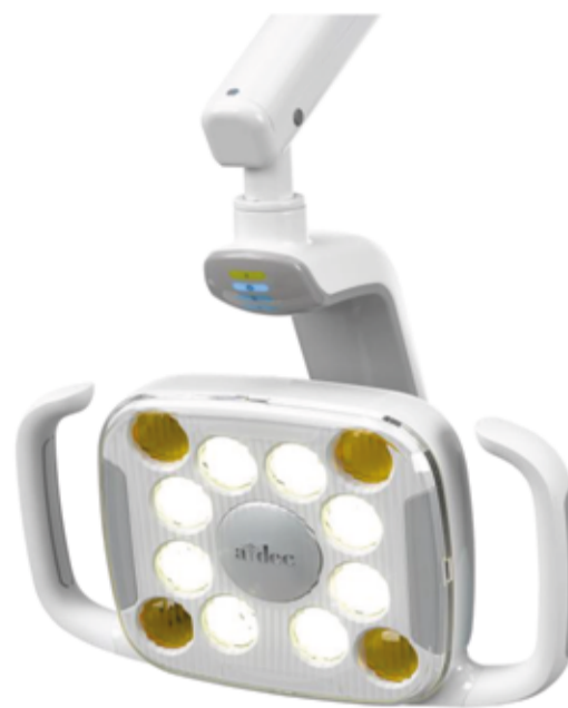
Reflektor LED 571