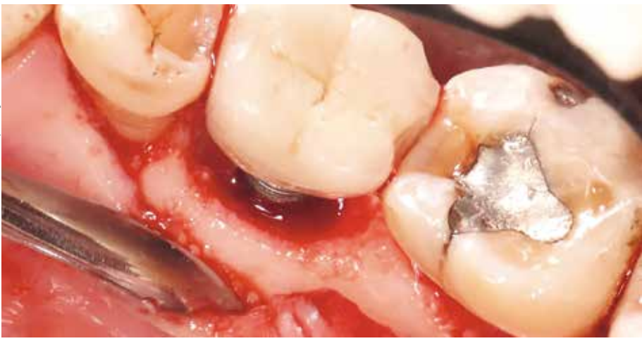
Nova istraživanja pokazuju da bi limunska kiselina mogla biti učinkovito sredstvo u borbi protiv periimplantitisa.