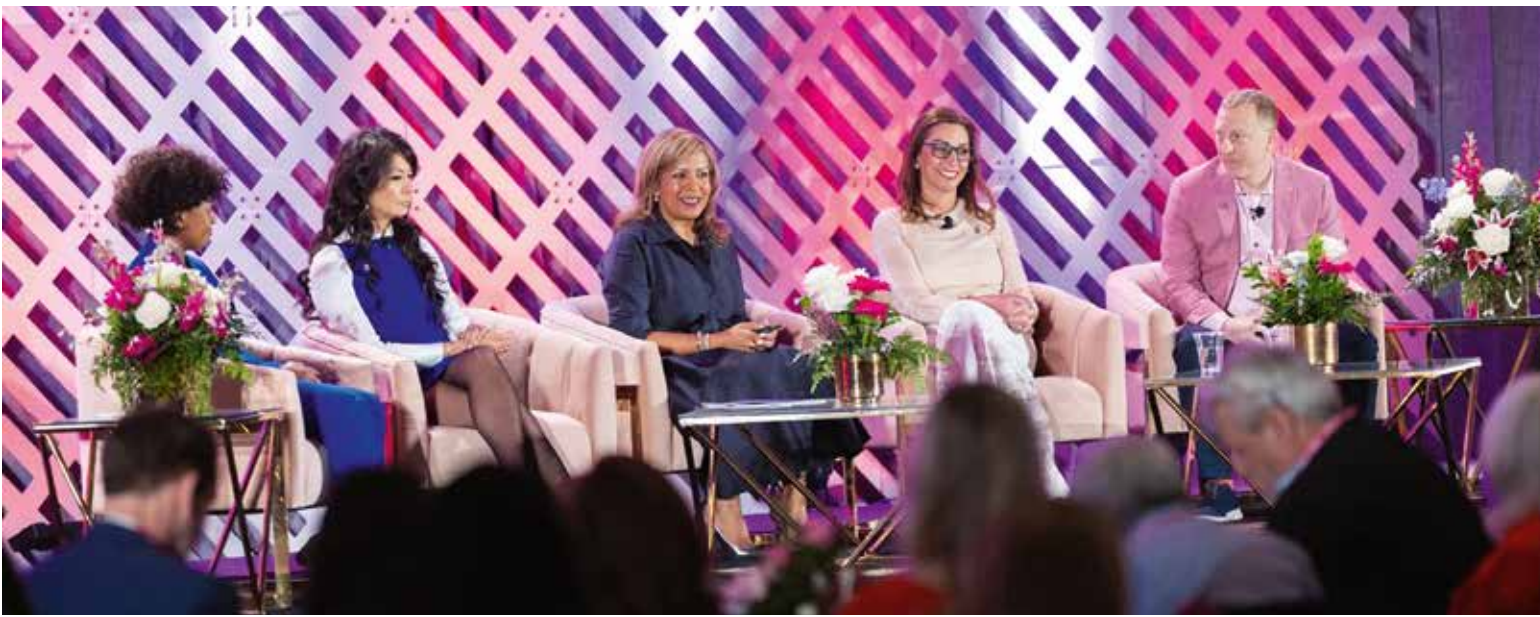
(Slika: Women in DSO)