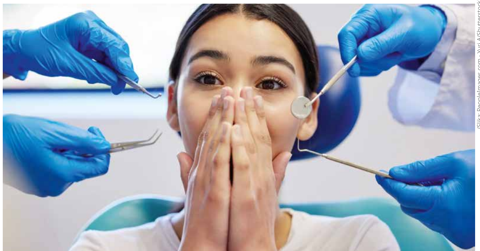
Studija nastoji podići svijest u stomatološkoj zajednici o nizu jedinstvenih izazova s kojima se žene suočavaju u vezi s oralnim zdravljem.