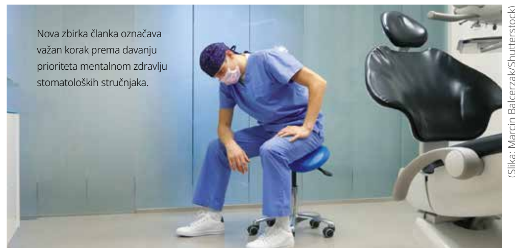
Nova zbirka članka označava važan korak prema davanju prioriteta mentalnom zdravlju stomatoloških stručnjaka.

Iako se nikada ne može očekivati da će iskorijeniti stres iz modernog radnog okruženja, BDJ treba pohvaliti za isticanje ovog ključnog pitanja, vitalni prvi korak u ublažavanju tekućih problema u ovom području.