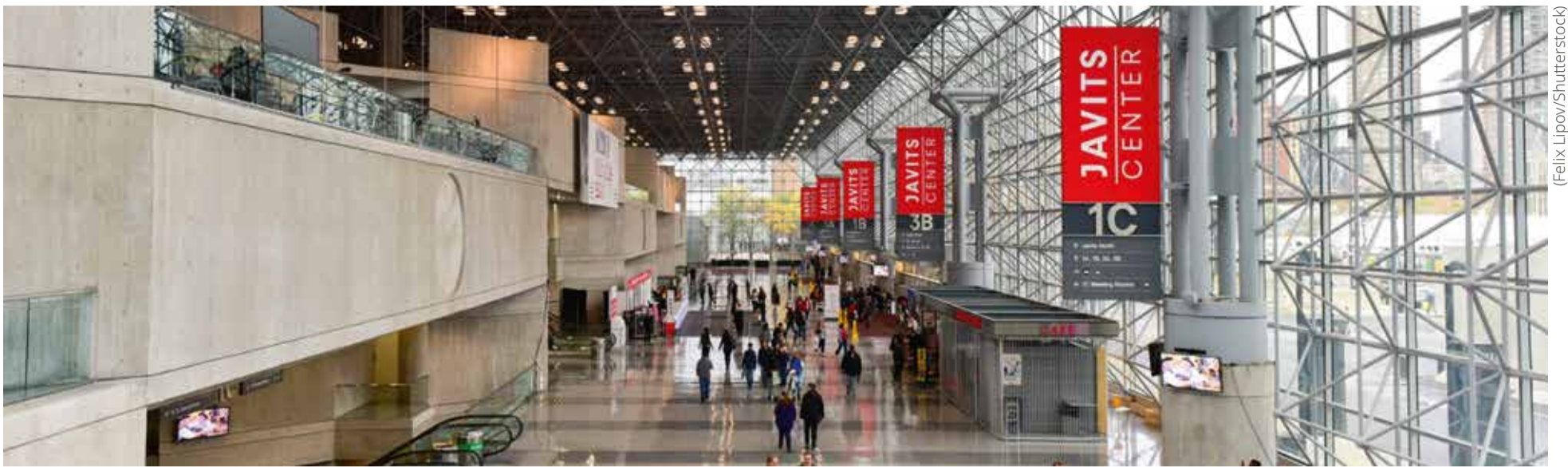
GNYDM se održava u kongresnom centru Jacob K. Javits u New Yorku.