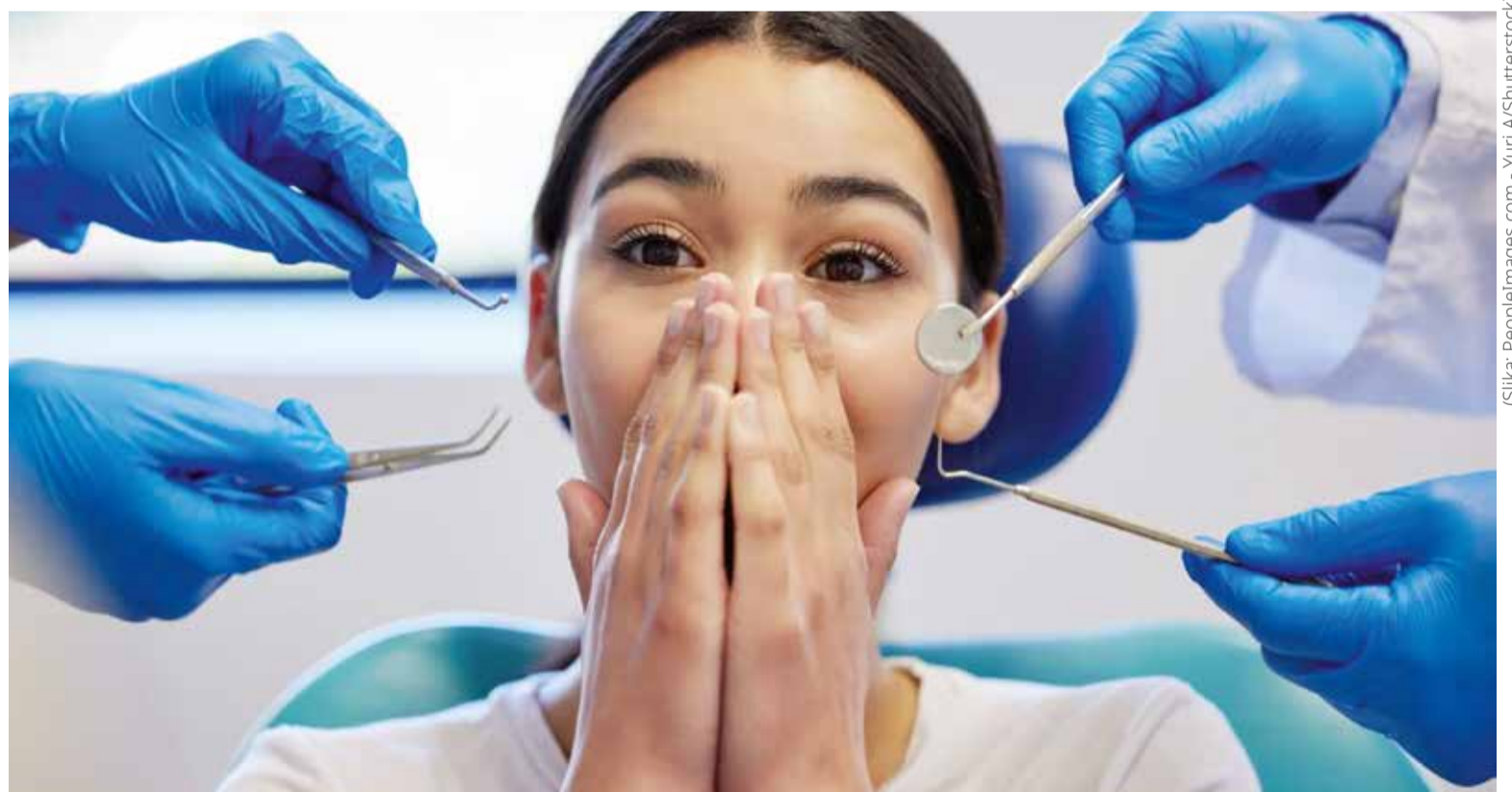
Studija nastoji podići svijest u stomatološkoj zajednici o nizu jedinstvenih izazova s kojima se žene suočavaju u vezi s oralnim zdravljem.