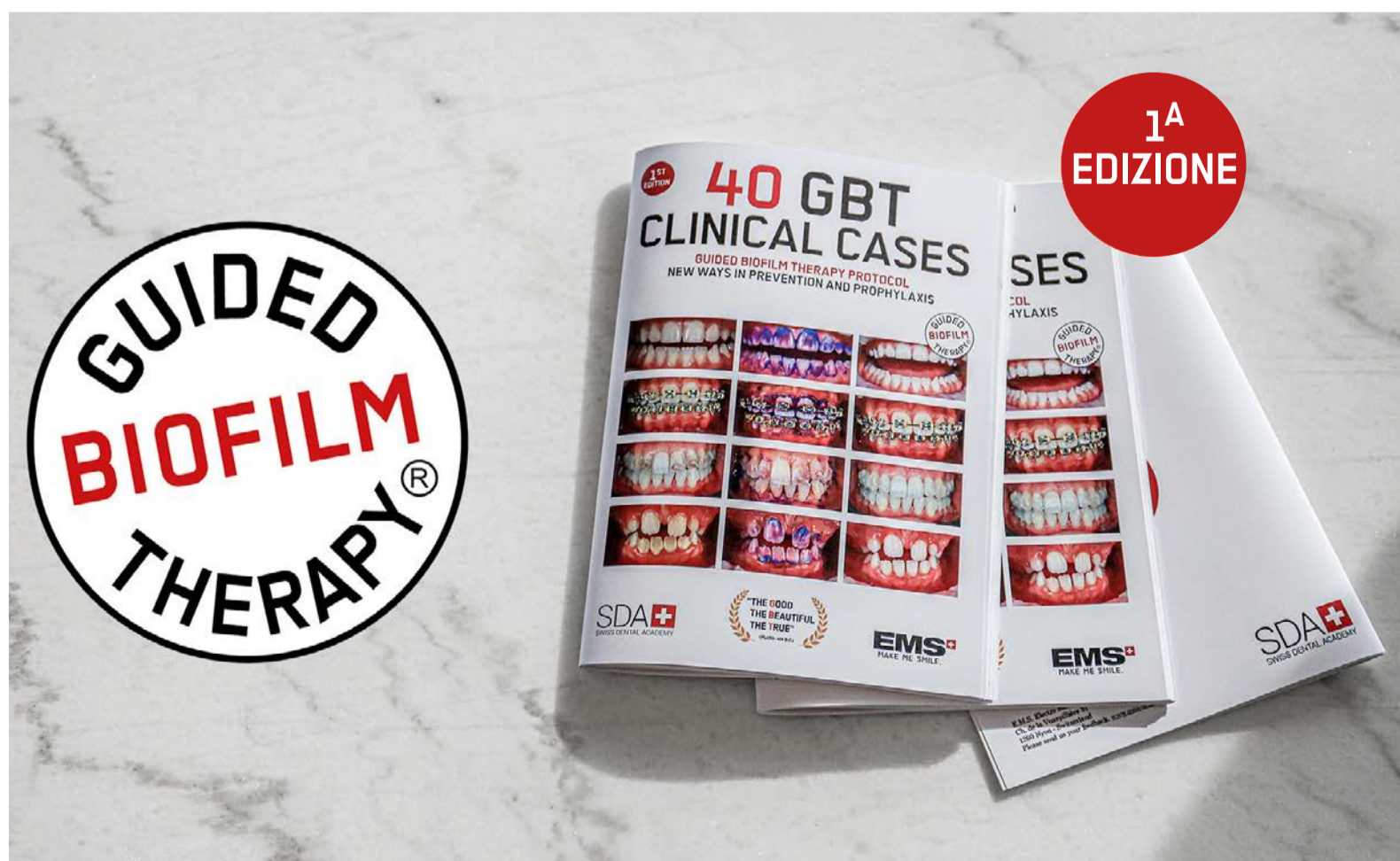
Fig. 1 - EMS è da sempre in prima linea nel combattere la battaglia per la completa rimozione del biofilm orale.