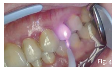
Fig. 4 - Il gel di fluoro viene irradiato mediante laser a diodi da 915 nm (POCKET LASER, 88Dent). Viene utilizzata una fibra ottica non attivata, utilizzata in modalità defocalizzata, per 30-60 secondi a elemento dentario con potenze applicate comprese tra 0.2 W e 0.6 W. L'operazione viene ripetuta per 3 volte ad elemento dentario.