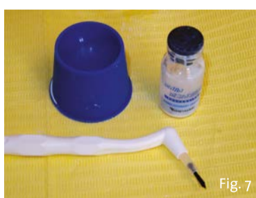
Fig. 7 - Viene utilizzata soluzione desensibilizzante di nanoidrossiapatite. (Dentin Desensitizer; Ghimas) Il prodotto si presenta di consistenza semiliquida e di colore bianco.