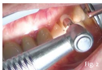
Fig. 2 - La decontaminazione preliminare delle superfici dentarie è la premessa per le successive fasi di desensibilizzazione.