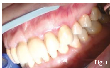
Fig. 1 - Situazione clinica iniziale. La paziente presenta un sensibilità dentale elevata riferita agli elementi dentali 24, 25, 26.

Bibliografia disponibile presso l'editore.