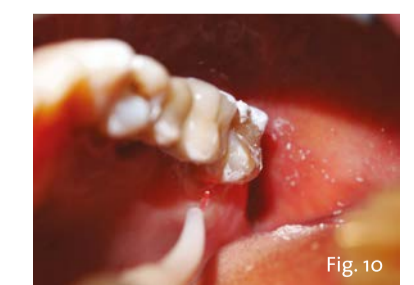
Fig. 10 - Durante la fase di stabilizzazione della soluzione, è possibile irradiare le superfici dentarie utilizzando laser a diodi da 915 nm (POCKET LASER, 88Dent) in modalità defocalizzata per 30 sec. La procedura viene ripetuta per 3 volte ad elemento dentario.