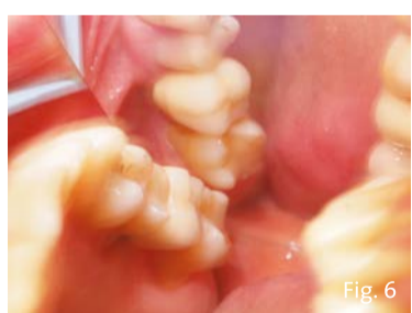
Fig. 6 - Sono presenti multiple recesioni gengivali, in presenza di una spiccata ipersensibilità dentinale, limitata all'elemento dentario 2.7.