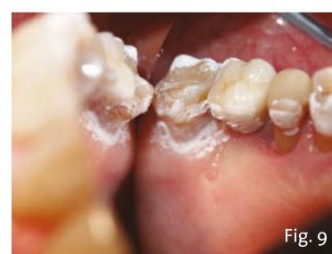
Fig. 9 - In seguito all'applicazione endorale della soluzione, nell'arco di 30 secondi si assiste di norma alla disidratazione parziale del prodotto e alla sua fissazione transitoria sulle superfici dentarie.