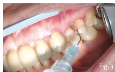
Fig. 3 - Un gel di fluoruro di sodio (Desensibilizer Professional. Dental-Moro) è inserito in un'apposita siringa con applicatori di precisione monouso viene applicato nelle aree cervicali degli elementi dentali sensibili.