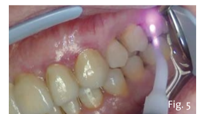
Fig. 5 - L'operazione viene ripetuta per 2-3 volte a elemento dentario. Al termine della procedura il prodotto viene opportunamente aspirato e le superfici dentarie delicatamente lavate con un getto d'acqua.