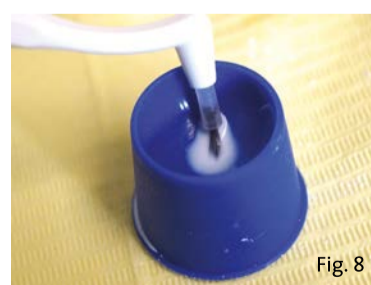
Fig. 8 - Mediante l'utilizzo di un contagocce, il prodotto è miscelato in un apposito dappen, per poi essere distribuito sulle superfici dentali grazie a un pennellino monouso.