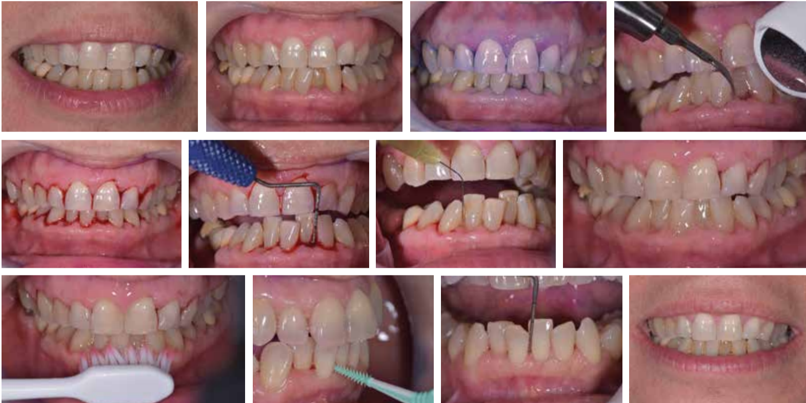
Case report di terapia parodontale non chirurgica e utilizzo di ozono terapia con olio di oliva ozonizzato Perioral 3 e Ialozon gel.

Professore Associato Università Sapienza di Roma. Pres.te A.T.A.S.I.O. (Accademia Tecnologie Avanzate nelle Scienze di Igiene Orale).