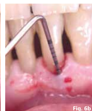
Figg. 6a, 6b - Sondaggio dopo terapia causale.