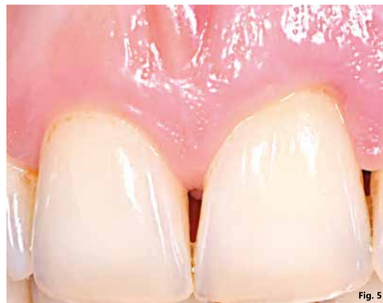
Fig. 1 - Aspetto clinico del paziente alla prima visita. Viene applicato Ozosan® per 8 min e lavato con fisiologica; Fig. 2 - Guarigione a 5 gg. Tessuti ancora edematosi. Viene fatta una terza applicazione di ozosan per 2 minuti; Fig. 3 - Applicazione di Ozosan per 2 min; Fig. 4 - Guarigione a 2 sett. Notare la recessione dei tessuti dovuti ad una precedente strumentazione eccessiva; Fig. 5 - Guarigione a 2 mesi dove si nota la progressiva copertura della recessione.

come dispositivo medico di classe IIA. L'ozono è estremamente reattivo e necessita essere veicolato in modo da essere rilasciato nel luogo di utilizzo in dose efficace. Ozosan Gel usa un gel a base di olio di girasole che deve essere mantenuto refrigerato e rilascia l'ozono una volta che viene in contatto con il calore delle mucose. La sua efficacia è stata dimostrata nella cura delle osteonecrosi 9 dove da 3 a 10 applicazioni del prodotto per 10 minuti hanno portato alla guarigione delle lesioni. Materni et al (2023) 10 lo hanno usato per 2 minuti dopo l'estrazione di ottavi ed hanno ottenuto una riduzione dell'incidenza di dried socket dal 21,5% del controllo al 2% del test. Nell'articolo viene esaminata anche la tempistica dell'efficacia ossidante dell'ozono che si presenta dipendente dal tempo. A 2 minuti solo il 20% del potere ossidante viene rilasciato con un effetto primariamente stimolante la guarigione. Entro i 3-4 minuti è prodotto il 40% dell'effetto che sale all'80% a 7 minuti e finisce entro 10 minuti. L'uso di questo gel non è stato ancora verificato in studi randomizzati controllati in parodontologia. L'unico studio presente con un gel ozonato associato allo scaling e root