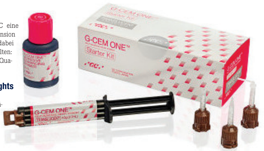
• G-CEM ONE ist ein echter Alleskönner. Das Befestigungs-Composite ist sowohl für die selbstadhäsive als auch für die adhäsive Befestigung aller Arten von indirekten Restaurationen geeignet. • G-CEM ONE is a real all-rounder. The luting composite is suitable for both self-adhesive and adhesive luting for all types of indirect restorations.

At the end of his speech, he invited participation in the fifth International Dental Symposium on 16 and