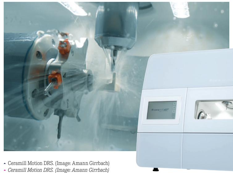
• Ceramill Motion DRS. (Image: Amann Girschbach) • Ceramill Therm DRS. (Image: Amann Girschbach)

Teilnehmende haben zudem die Möglichkeit, einen Tourbus zu buchen, der die Ceramill DRS Solution direkt zu