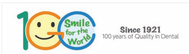
GCs Credo zum Jubiläumjahr: Smile for the World - Since 1921 - 100 years of Quality in Dental. GC's motto for its anniversary year: Smile for the World - Since 1921 - 100 Years of Quality in Dental.