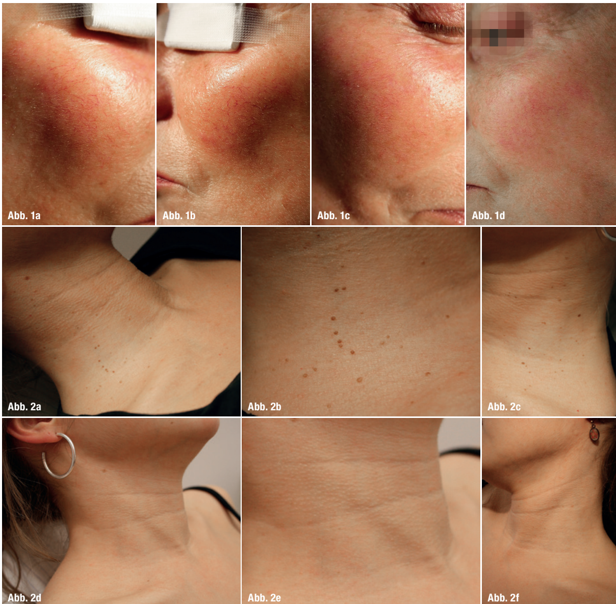
Abb. 1a–d: Teleangiektasien vor (a und b) und nach (c und d) einer Behandlung mit IDAS. Abb. 2a–f: Stielwarzen vor (a, b und c) und nach (d, e und f) einer Behandlung mit IDAS.

Bei der Laserbehandlung einer Rosazea im Gesicht rechne ich im Schnitt mit drei Sitzungen im Abstand von je vier Wochen, bis ein zufriedenstellendes Ergebnis erreicht ist. Den IDAS-Laser kombiniere ich je nach Schweregrad der Rosazea mit entsprechenden lokalen Therapeutika, welche der Patient im Anschluss zu Hause anwendet. Hierbei werden zunächst in der Praxis die einzelnen, sichtbaren Gefäße durch den Laser entfernt und die zurückbleibende flächige Rötung durch die lokale Therapie reduziert bzw. beseitigt. In sehr seltenen Fällen werden Medikamente zur Unterstützung verschrieben, dies ist jedoch in der Regel nicht erforderlich. Mit etwas zeitlichem Abstand kann zur Verbesserung des gesamten Hautbildes zusätzlich ein Fruchtsäurepeeling durch-