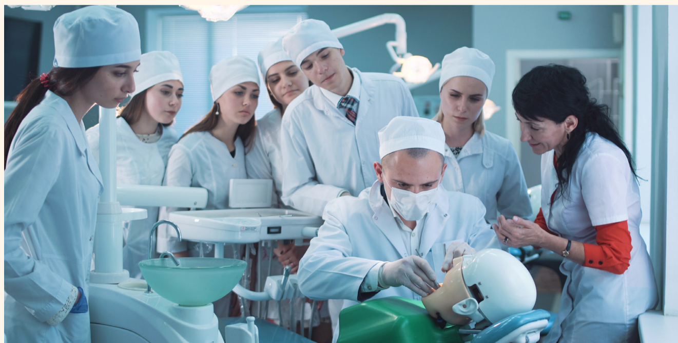
En todos los países europeos ha existido esta inquietud de adaptar los programas educativos al progreso del conocimiento, y más en ciencias de la salud, donde es preceptivo para la seguridad de los pacientes.