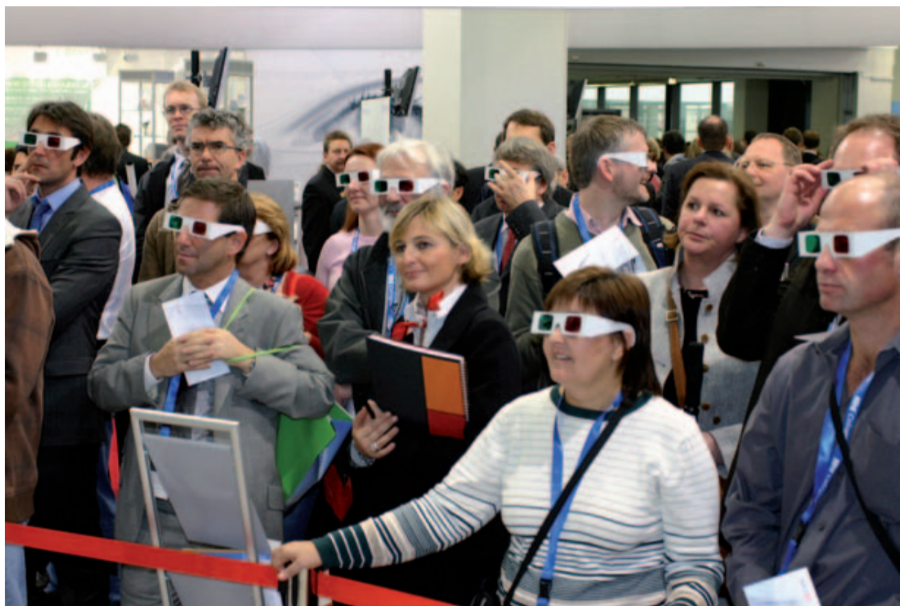
An zahlreichen Ständen erlebten die IDS-Besucher Live-Vorfürungen. Im Mittelpunkt des Interesses standen digitale Methoden zur Messung, Dokumentation und Qualitätssicherung, wie hier bei der Demonstration einer digitalen Abformung.

Im Mittelpunkt des Interesses standen eindeutig digitale Methoden zur Messung, Dokumentation und Qualitätssicherung. Dabei geht der Trend zu immer stärkerer Vernetzung der Praxen und Dentallabore und in Richtung beschleunigter Arbeitsabläufe und präziserer Ergebnisse. An zahlreichen Ständen erlebten die Besucher bei Live-Vorfürungen, wie Computer die Funktionsdiagnostik, die Bestimmung der Kieferrelation oder die Bissregistrierung elektronisch unterstützen und die Farbbestimmung oder die Planung von Implantationen leichter machen. Vielfach definierten Unternehmen die Schnittstellen zwischen zahnärztlicher und zahn technischer Arbeit völlig neu und helfen den Dentallaboren mit Software-Unterstützung Kosten zu sparen und gleichzeitig die Qualität zu verbessern. So überraschte der weltweite Marktführer von Präzisionsabformmassen, 3M ESPE, mit dem Lava Chairside Oral Scanner C.O.S. und setzt einen neuen Maßstab für Abformpräzision. Statt wie bisher ein Gipsmodell, digitalisiert der Intraoralscanner mit 3 x 20 Bildern pro Sekunde die Situation bereits im Patientenmund. Für Dentallabore bedeutet dies, dass sie auf digitalem Weg erstmals dieselben Informationen erhalten wie der Zahnarzt, und dass das bisher oft übliche Raten bei der Festlegung der Präparationsgrenze künftig entfällt. Ein Gipsmodell wird überflüssig. Stattdessen er-