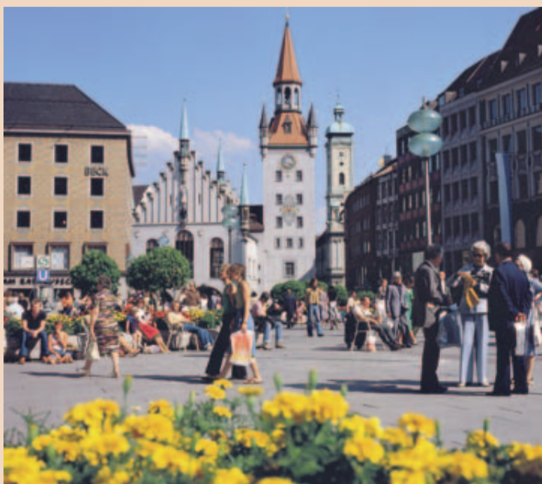
Frühling in München: Zur 19. Jahrestagung im Mai ist auch der Marienplatz schon aufgeblüht.

Herr Dr. von Landenberg, wir danken Ihnen für das Gespräch! ☒