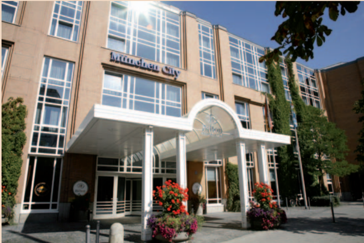
Willkommen im Hotel Hilton München City. Es bietet den angemessenen Rahmen für die DZOI-Jahrestagung.

19. Jahrestagung des DZOI am 1. und 2. Mai in München