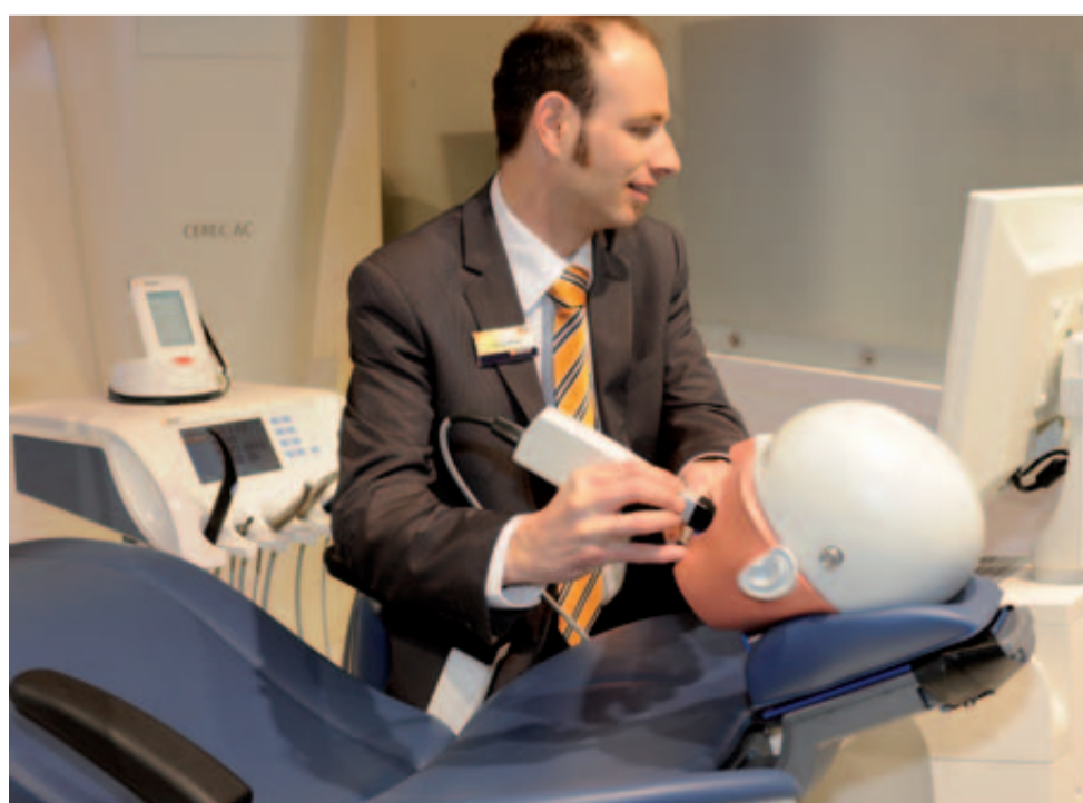
Einfache Handhabung – Mit 100 digitalen Aufnahmen aus Sironas CEREC Bluecam-Kamera errechnet die CEREC 3D-Software die Parameter für bis zu 4-gliedrige Provisionen.