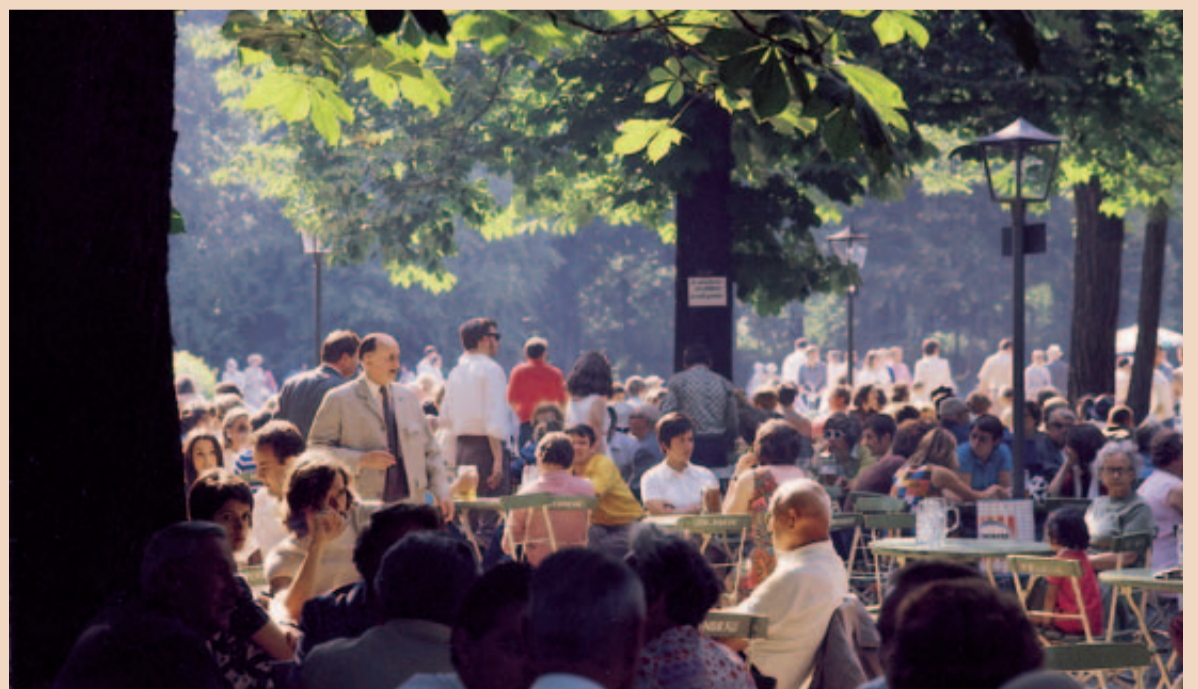
Vielleicht bietet sich nach dem Tagungsprogramm noch ein Besuch in einem der berühmten Münchner Biergärten an.