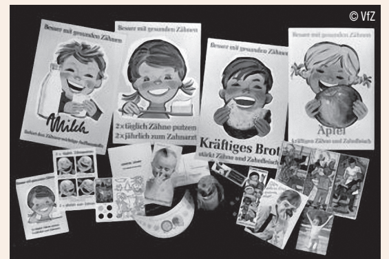
Entwicklung erster eigenständiger Medien zur Zahngesundheitsaufklärung wie Merkblätter, Broschüren, Plakate. Einführung des Zahnpflegeteils.