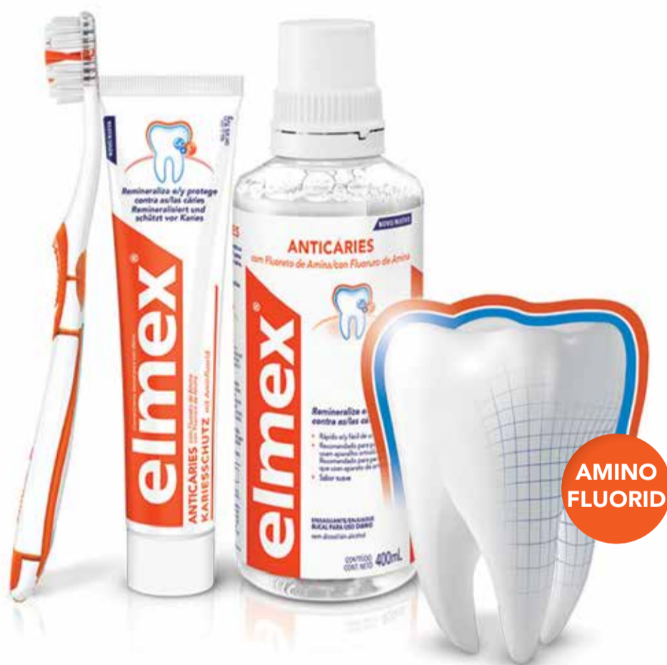
elmex® Caries Protection с аминофлуорид технология