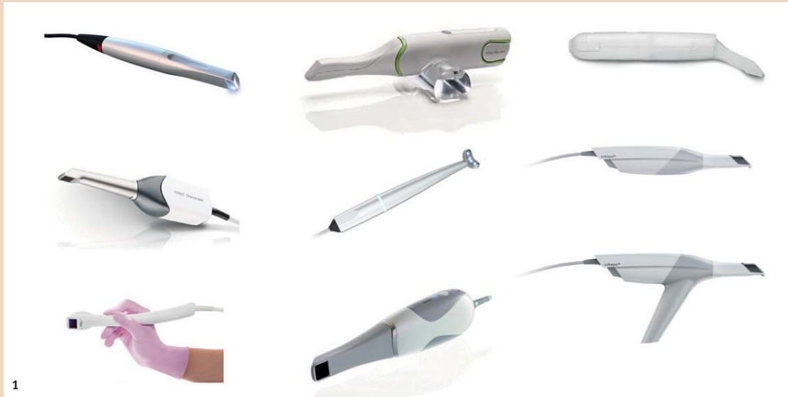
Abb. 1: Nicht nur Grösse und Gewicht, auch die Form der Handstücke ist ein Entscheidungskriterium bei der Intraoralscanner-Wahl.