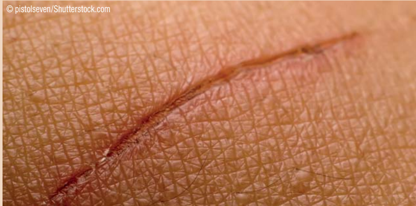
Nervenzellen in der Haut helfen, Wunden zu heilen.

nachweisen, dass die Reparaturzellen der Nerven u.a. für das Verschluss der Wunde wichtig sind,