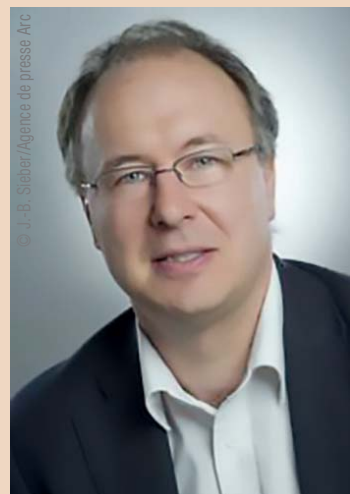
Pierre-Yves Maillard, der zuständige SP-Staatsrat, rechnet bei Zustimmung mit Lohnabgaben zwischen 0,5 und 0,7 Prozent.

Hauptkritikpunkt der Initiativen sind die derzeit hohen finanziellen Belastungen bei Zahnarztbehandlungen für den Einzelnen. Bisher tragen Schweizer knapp 90 Prozent der Kosten selbst, was schwerwiegende Fol-