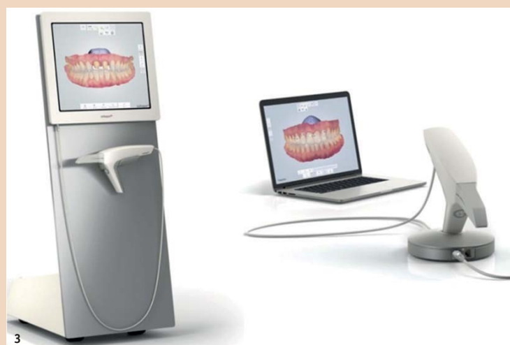
Abb. 3: Zwei Geräte-Varianten werden unterschieden: die Cart- (links) und die Laptop-Version (rechts). Im Bild: TRIOS® Intraoralscanner von 3Shape.

Einige Geräte bieten die Option an, die Präparationsgrenze direkt am Scanner festzulegen. Dies ist besonders dann hilfreich, wenn durch schwierige Verhältnisse eine klare Festlegung der Präparationsgrenze im Labor fraglich erscheint.