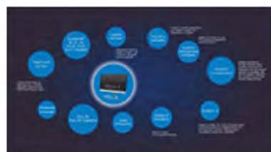
Uvijek dobro povezani