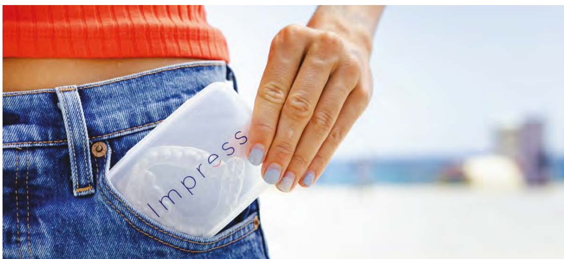
Impress je objavio da će njihova najnovija vodeća klinika biti smještena u Leedsu u UK-u te da će nuditi početne konsultacije pacijentima uživo.

Impress pacijenti dobiju početne konsultacije na jednoj od naših klinika. To uključuje puni oralni pregled, radiografski snimak i 3D-skenove. Od tog trenutka, medicinski specijalisti u Impressu razvijaju personaliziranu virtualnu simulaciju cijelog procesa tretmana. Pacijent potom koristi mobilnu dentalnu aplikaciju kod kuće kako bi pratio svoj