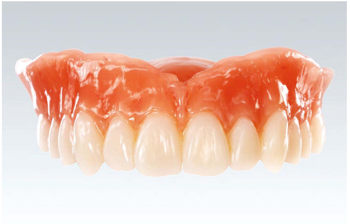
Ceramill FDS sada ima dozvolu za Ivotion materijale iz Ivoclara.

„Širenjem zubne biblioteke, mogućnosti proizvodnje i opcija dizajna, Ceramill FDS je ponudio maksimalnu fleksibilnost. Zahvaljujući ažuriranom softveru sada smo čak i u boljoj poziciji da pokrijemo različite segmente troškova tako da se možemo optimalno fokusirati na individualne želje pacijenata“, kazala je Maria Stroppe, rukovodilac laboratorije za CAD/CAM softver i 3D printanje u Amann Girrbachu.