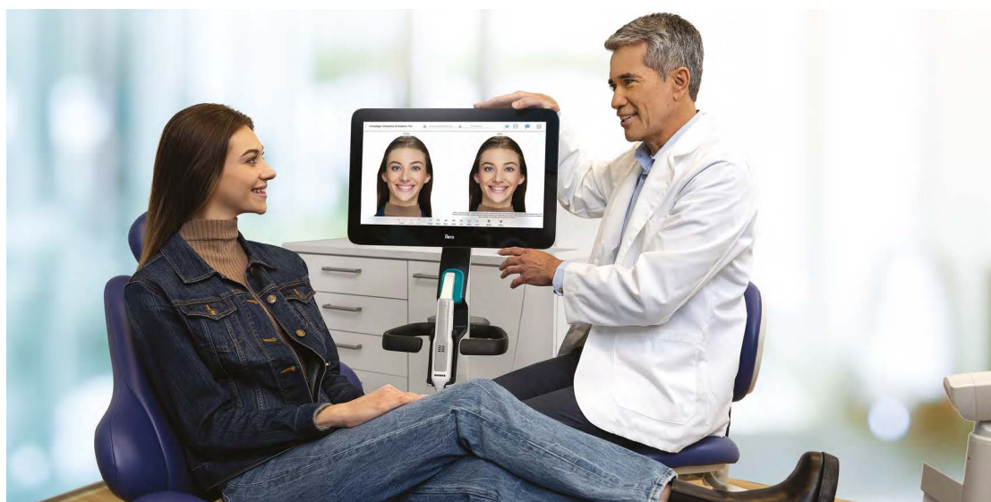
Stomatolog tokom konsultacija za Invisalign tretman koristeći Align Invisalign Outcome Simulator Pro na iTero Element 5D Plus sistemu slikanja.

TEMPE, Arizona, SAD: Align Technology je predstavila novi digitalni alat koji koristi napredne algoritme kako bi ponudila vizualizaciju mogućeg budućeg osmijeha pacijentima koji će imati nakon tretmana providnim folijicama. Alat je dostupan na iTero Element Plus Series sistemu slikanja, a iz kompanije tvrde da realistična simulacija rezultata tretmana može biti gotova za nekoliko minuta, transformišući konsultacijski proces.