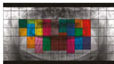
Autofokus – izvrsne snimke, automatski