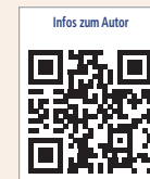
Infos zum Autor

medienleiter PR Seitenberggasse 65–67/2/22 1160 Wien, Österreich Tel.: +43 680 2160861 leiter@medienleiter.net www.medienleiter.net