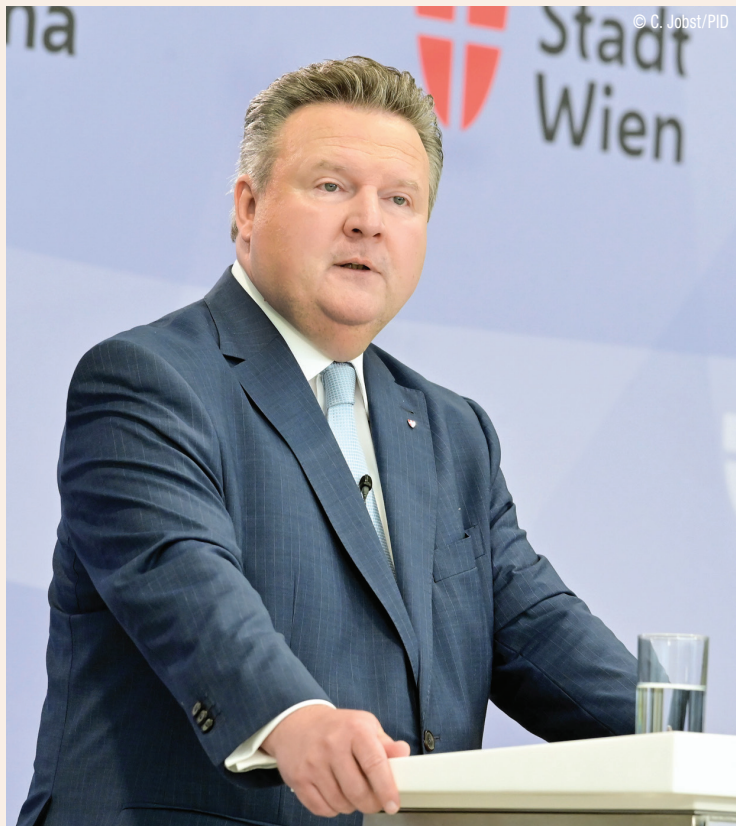
Wiens Bürgermeister Michael Ludwig im Festsaal des Rathauses.

WIEN – Die Stadt Wien wird auch nach den bundesweiten Lockerungsschritten am 5. März bei ihrer strengeren Linie in Sachen Coronamaßnahmen bleiben. Das bekräftigte Bürgermeister Dr. Michael Ludwig am Rande eines Pressterters am 1. März – betroffen sind etwa die 2G-Regel in der Gastronomie und die Masken-