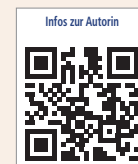
Infos zur Autorin

IBW CONSULTING Hoppegarten 56 59872 Meschede Deutschland Tel.: +49 174 3102996 www.iwb-consulting.info