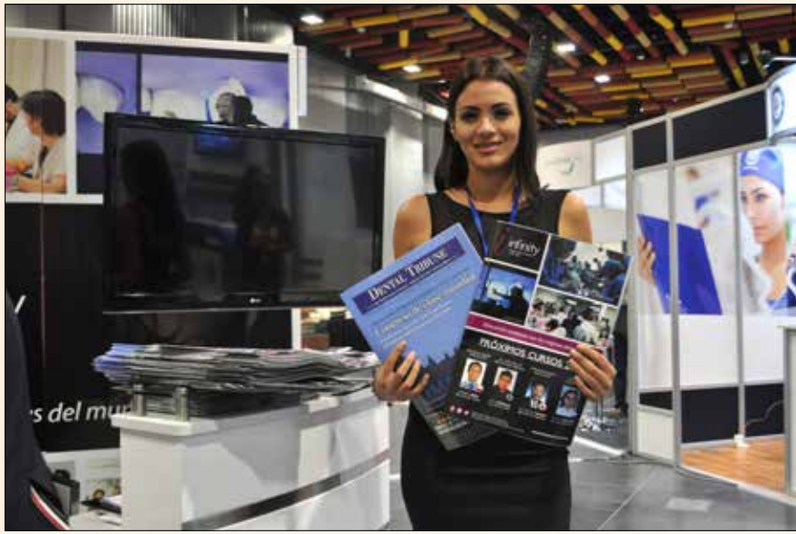
Una edecán muestra el número especial de Dental Tribune en el stand de la Clínica Dental Especializada Infinity de Lima en la exposición comercial del Congreso Lima 2016.