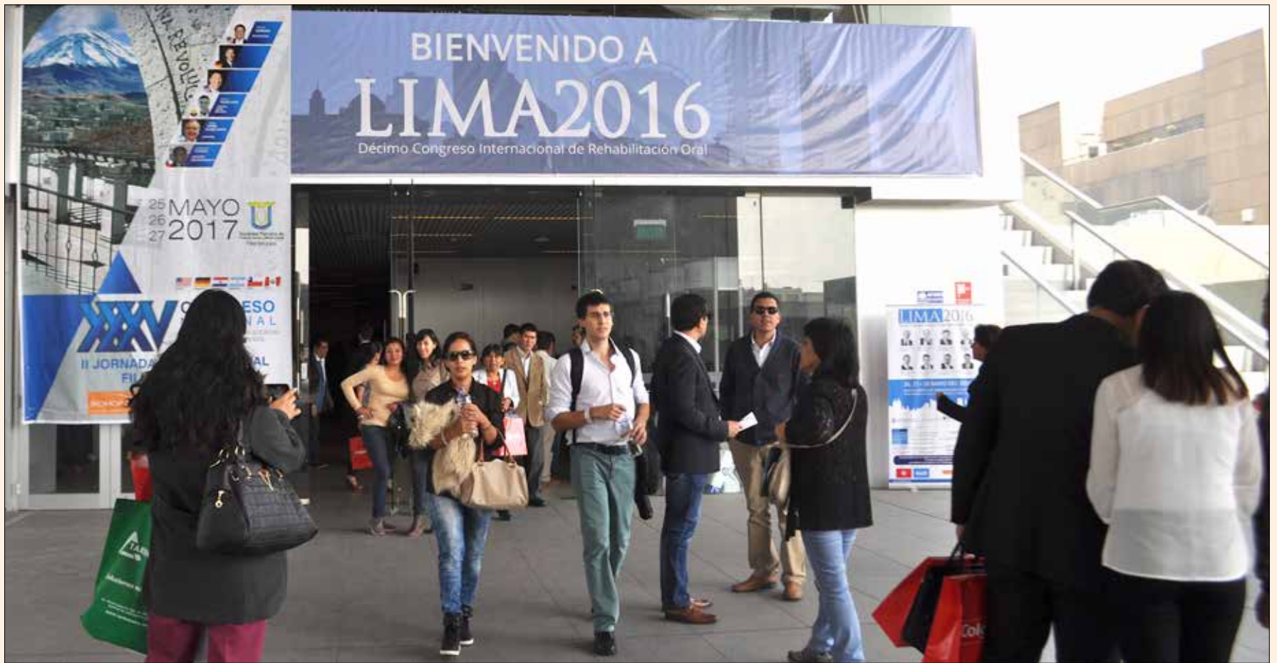
La entrada al Congreso Lima 2016 en el Nuevo Centro de Convenciones de la capital peruana.