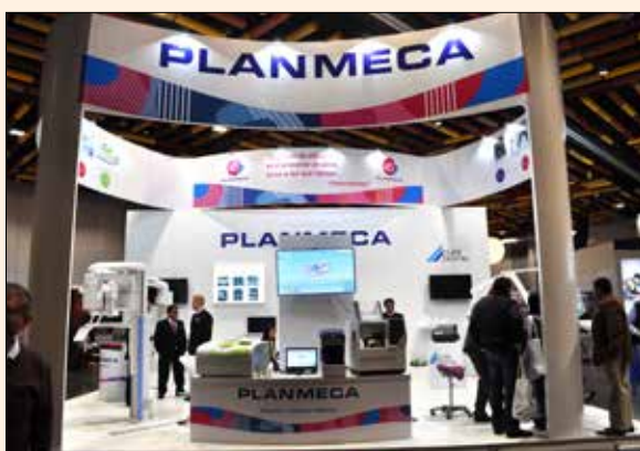
Planmecha montó un gigantesco stand con toda su línea de avanzados dispositivos.