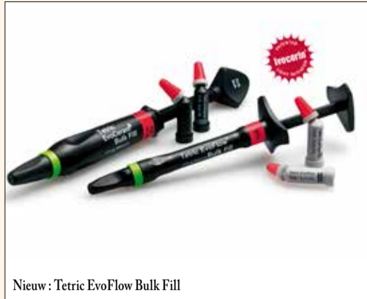
Nieuw: Tetric EvoFlow Bulk Fill

De succesvolle presentatie van de Tetric Evo productlijn is algemeen erkend. Recentelijk, heeft het bedrijf dit succes en de continue verdere ontwik-