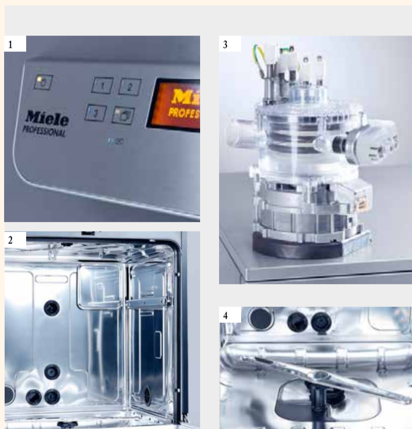
Foto 1: Gemakkelijk te bedienen: de nieuwe thermo-desinfectoren van Miele Professional blinken uit in gebruiksgemak. De drie meest gebruikte programma's zijn bijzonder snel te kiezen via een sneltoets. Het display geeft in de gewenste taal informatie weer over belangrijke programmameters, zoals de reële temperatuur of het ladingnummer.

Bleken wordt gedaan met behulp van Cavex Bite&White, een bewezen, effectieve en vooral veilige bleekgel met 16% carbamideperoxide (staat »