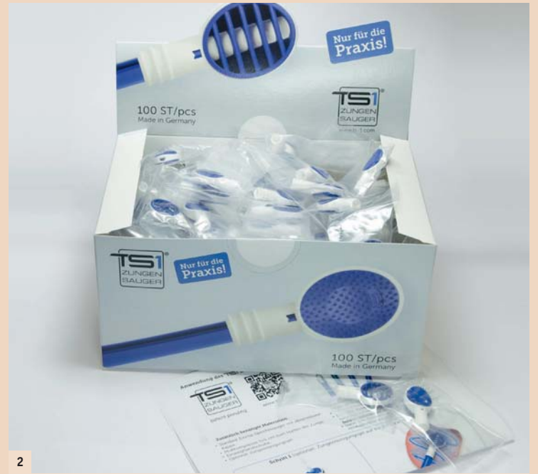
Abb. 2: TSI Zungensauger Praxis-Set.

Darüber hinaus erhalten wir hervorragende Unterstützung von führenden Zahnmedizinern, wie z.B. kürzlich auf dem 5. Halitosis-Tag in Berlin am 12. März, wo