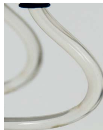
Mit SAFEWATER von BLUE SAFETY

Informieren und absichern. Jetzt. Kostenfreie Hygieneberatung unter 0800 25 83 72 33 Erfahrungsberichte auf www.safewater.video