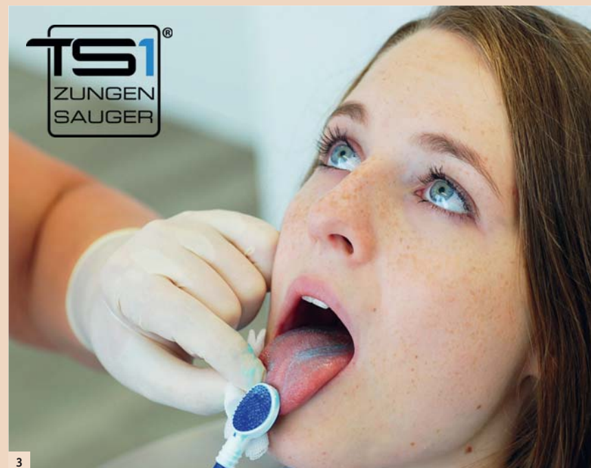
Abb. 3: Einfach in der Anwendung: aufstecken, auftragen, absaugen.