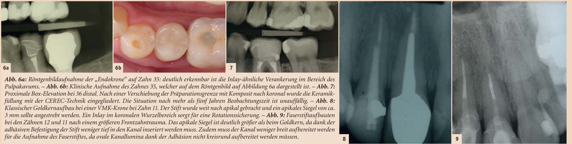
Abb. 6a: Röntgenbildaufnahme der „Endokrone“ auf Zahn 35: deutlich erkennbar ist die Inlay-ähnliche Verankerung im Bereich des Pulpakavums. – Abb. 6b: Klinische Aufnahme des Zahnes 35, welcher auf dem Röntgenbild auf Abbildung 6a dargestellt ist. – Abb. 7: Proximale Box-Elevation bei 36 distal. Nach einer Verschiebung der Präparationsgrenze mit Komposit nach koronal wurde die Keramikfüllung mit der CEREC-Technik eingegliedert. Die Situation nach mehr als fünf Jahren Beobachtungszeit ist unauffällig. – Abb. 8: Klassischer Goldkernaufbau bei einer VMK-Krone bei Zahn 11. Der Stift wurde weit nach apikal gebracht und ein apikales Siegel von ca. 3 mm sollte angestrebt werden. Ein Inlay im koronalen Wurzelbereich sorgt für eine Rotationssicherung. – Abb. 9: Faserstiftaufbauten bei den Zähnen 12 und 11 nach einem größeren Frontzahntrauma. Das apikale Siegel ist deutlich größer als beim Goldkern, da dank der adhäsiven Befestigung der Stift weniger tief in den Kanal inseriert werden muss. Zudem muss der Kanal weniger breit aufbereitet werden für die Aufnahme des Faserstiftes, da ovale Kanallumina dank der Adhäsion nicht kreisrund aufbereitet werden müssen.

Goldkernaufbau oder die direkten Stiftstechniken mit Faser-, Titan- oder Zirkonstiften, wobei Letztere wegen der nicht korrigierbaren Misserfolgsrisiken besser nicht mehr angewendet werden.