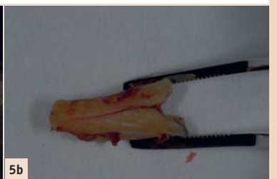
Abb. 1: Zahn 36 wurde alio loco mit einer Wurzelkanaleinlage und einer provisorischen (deutlich insuffizienten) Füllung versorgt. Eine sinnvolle Rekonstruktion scheint nicht möglich, da Zahn 38 nach mesial in den Defekt gekippt ist und bei einer vollständigen Exkavation wahrscheinlich eine Perforation in den interradikulären Raum erfolgt. Eine Extraktion des Zahnes scheint indiziert. Interessant ist, dass bei 36 die mesiale Wurzel vor einigen Jahren entfernt wurde und die distale Wurzel mit einer VMK-Krone mit Goldkernverankerung versorgt wurde. – Abb. 2: Zahn 14 wurde alio loco wurzelkanalbehandelt. Die Aufbaufüllung wurde in der gleichen Sitzung wie die Wurzelkanalfüllung gelegt. Die Patientin hat die Zahnarztrechnung noch nicht beglichen, als sie sich mit Schmerzen im Notfalldienst meldet. Die Fraktur des palatinalen Höckers zieht weit nach apikal, sodass der Zahn nicht sinnvoll erhalten werden konnte. – Abb. 3a: Zahn 12 nach Entfernen VMK-Krone und Stiftaufbau. – Abb. 3b: Zahn 12 nach Bleichen und Stumpfaufbau mit Faserstift und Komposit. – Abb. 4: Entscheidungshilfe für die postendodontische Versorgung: In Blau ist die Versorgung für den Frontzahnbereich und in Orange für den Seitenzahnbereich dargestellt. Je nach klinischer Situation muss vom Schema abgewichen werden. – Abb. 5a: Verdacht auf Rissbildung in distaler Wurzel: transluzente Zone um die ganze distale Wurzel. – Abb. 5b: Extrahierte Zahnwurzel 25 mit Längsriß.

defekt orientiert und nicht zwingend bis auf Höhe Gingiva gelegt wird. Eine zusätzliche Klebefläche wird durch eine inlayförmige Fassung des Pulpakavums erreicht (Abb. 6a und b). Die Langzeitdaten sind positiv, und durch das Wegfallen einer Stiftaufbaufüllung ist die Keramikschnittstärke höher,