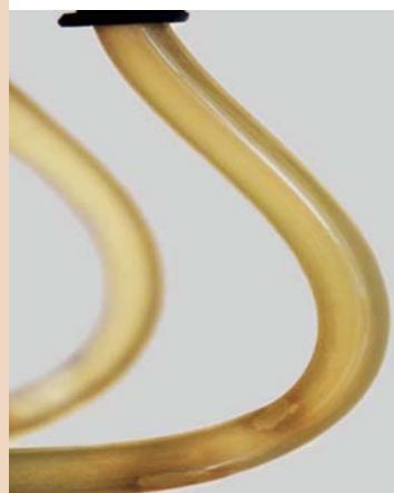
Wegen H 2 O 2 : Biofilmbildung

Klingt stichhaltig? Ist es auch. Und Sie können das auch.