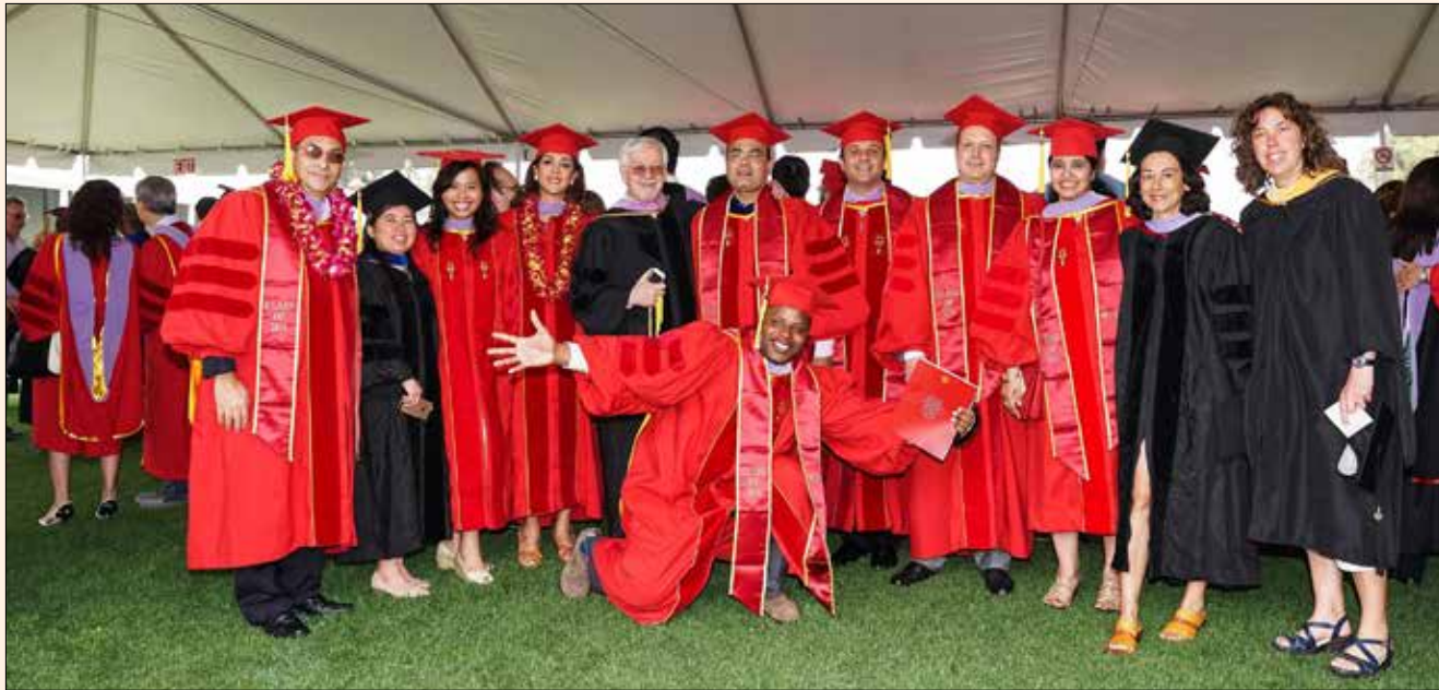
Una reciente graduación en la Escuela de Odontología de la Universidad del Sur de California en Los Angeles