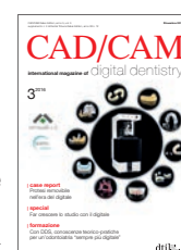
Immagine di copertina cortesemente concessa da cmf marelli srl, www.cmf.it