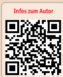
Infos zum Autor