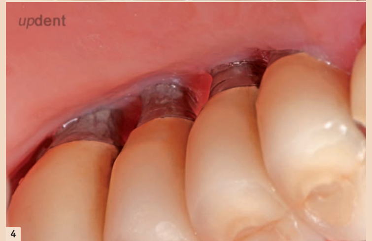
Abb. 3: Klinischer Zustand nach resectiver Chirurgie mit Implantoplastik, entzündungsfrei aber mit wenig verbleibender keratinisierter periimplantärer Mukosa bukkal. Patientin kommt regelmäßig zum 3-monatigen Recall. – Abb. 4: Von palatinal deutlich zu sehen der erschwerte Zugang für Hygienemaßnahmen, bedingt durch den resultierenden Unterschied im Niveau der Gewebe.

ren, Rauchen. Demnach können Patienten eingestuft werden als solche mit niedrigem, mittlerem und hohem Risikoprofil. Bei Patienten mit mittlerem Risiko sollten verbleibende Parodontaltaschen mit weiterführenden Mitteln eliminiert oder reduziert werden, bevor es zur Implantation kommt. Ein Beispiel für einen Patienten mit hohem Risikoprofil wäre einer, der eine signifikante Anzahl von Restaschen hat, die auf Sondieren bluten, mit suboptimaler Hygiene und/oder Rauchgewohnheit und/oder schlecht eingestelltem Diabetes mellitus. Bei solchen Patienten sollte die weiterführende Parodontaltherapie zur Taschenelimination und Zahnerhalt im Vordergrund stehen und eine Versorgung mit Implantaten zeitlich möglichst lang nach hinten hinausgeschoben werden. Auch sollten andere restaurative Alternativen in Erwägung gezogen werden. Das Erkennen des Risikoprofils eines Patienten setzt voraus, dass eine mögliche Parodontalerkrankung diagnostiziert und der Patient einer entsprechenden Therapie zugeführt wird. Auch bedarf es der in der Parodontaltherapie üblichen längeren Beobachtungszeiträume mit entsprechend regelmäßig erneuter Evaluierung der parodontalen Situation, bevor eine Einschätzung dazu gemacht werden kann, wie die individuelle Reaktion auf die Therapie ausfällt.