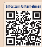
Infos zum Unternehmen

Darüber hinaus bieten wir FRIOS®-Augmentationsprodukte, Guided-Surgery-Technologien, CAD/CAM-Konzepte wie die patientenindividuellen ATLANTIS™ Abutments oder ATLANTIS™ ISUS (Implantat-Suprastrukturen) sowie das stepps®-Programm für die professionelle Praxisentwicklung.