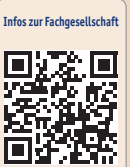
Infos zur Fachgesellschaft