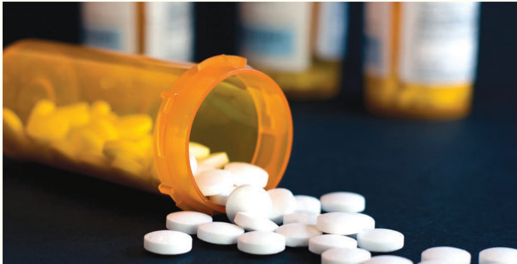
Istraživači iz SAD-a su otkrili da ibuprofen i drugi nesteroidni antiupalni lijekovi olakšavaju bol efikasnije u odnosu na opioide.

CLEVELAND, SAD: Sigurno i efikasno uklanjanje bola je veoma važna tema za dentalne prakticionere. Opioidi i neopiodna analgetička sredstva su među lijekovima koji se većinom propisuju dentalnim pacijentima kako bi im se uklonio bol. Međutim, prema novim ispitivanjima rezultata 460 objavljenih studija, opioidi nisu među najefikasnijim ili dugotrajnim opcijama uklanjanja akutnog dentalnog bola.