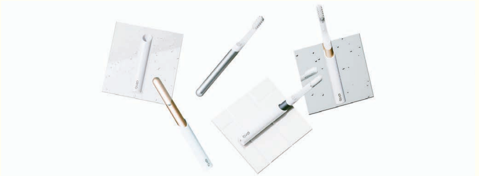
Mala kompanija sa sjedištem u New York-u dobila je 10 miliona finansijskih sredstava koja će im pomoći dostignuti broj od milion korisnika do kraja 2018. godine.

NEW YORK, SAD: Mala kompanija sa sjedištem u New York-u, Quip, nedavno je dobila 10 miliona finansijskih sredstava. Quip je kompanija koja se fokusira na proizvodnju četkica za zube koja ima cilj dokazati da dobar dizajn može imati veći utjecaj na oralno zdravlje od jednostavnih trikova. Nakon prodaje 100.000 četkica za zube u prvoj godini poslovanja, ova nova investicija bit će podrška koju kompanija treba kako bi ovaj biznis izrastao u veće tržište.