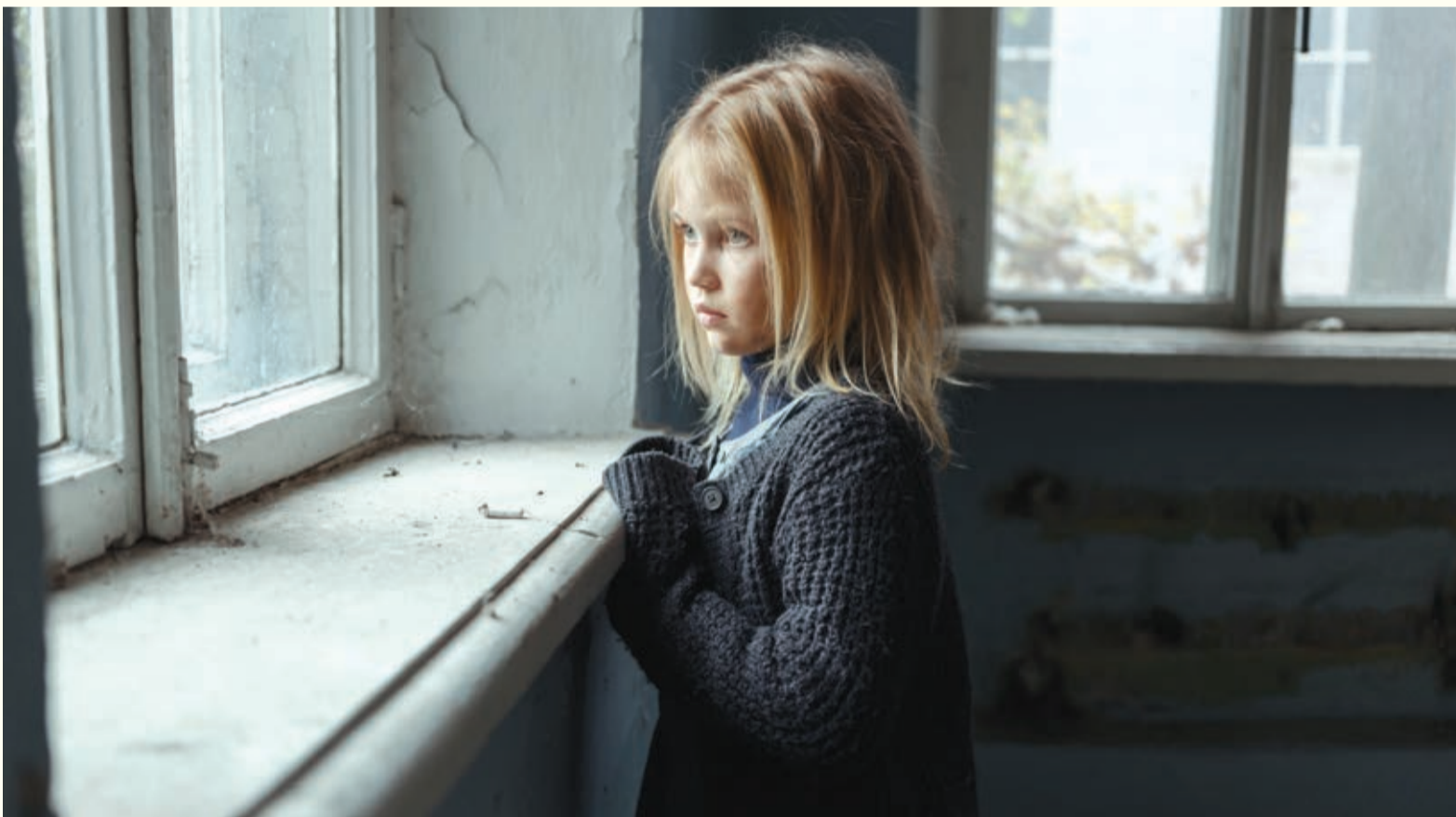
Anketa koja je nedavno sprovedena među medicinskim prakticionerima sa Wight ostrva ukazuje na sve više rasprostranjen problem u UK-u koji se tiče osviještenosti doktora u vezi sa pitanjem lošeg oralnog zdravlja i njegovom mogućom vezom sa zapostavljanjem djece.

LONDON, UK: Prema riječima istraživača sa Southhampton univerziteta u UK-u, dentalno zapostavljanje je znak zapostavljanja djece. U novoj studiji, istraživači su sagledali ulogu ljekara opšte prakse i njihovu osviještenost i razumijevanje oralnog zdravlja u identifikaciji slučajeva zapostavljanja djece. Rezultati pokazuju nedostatak edukacije i razumijevanja problema kao i vremenska ograničenja koja ljekare sprječavaju da pregledaju zube djeteta prilikom rutinskog pregleda.