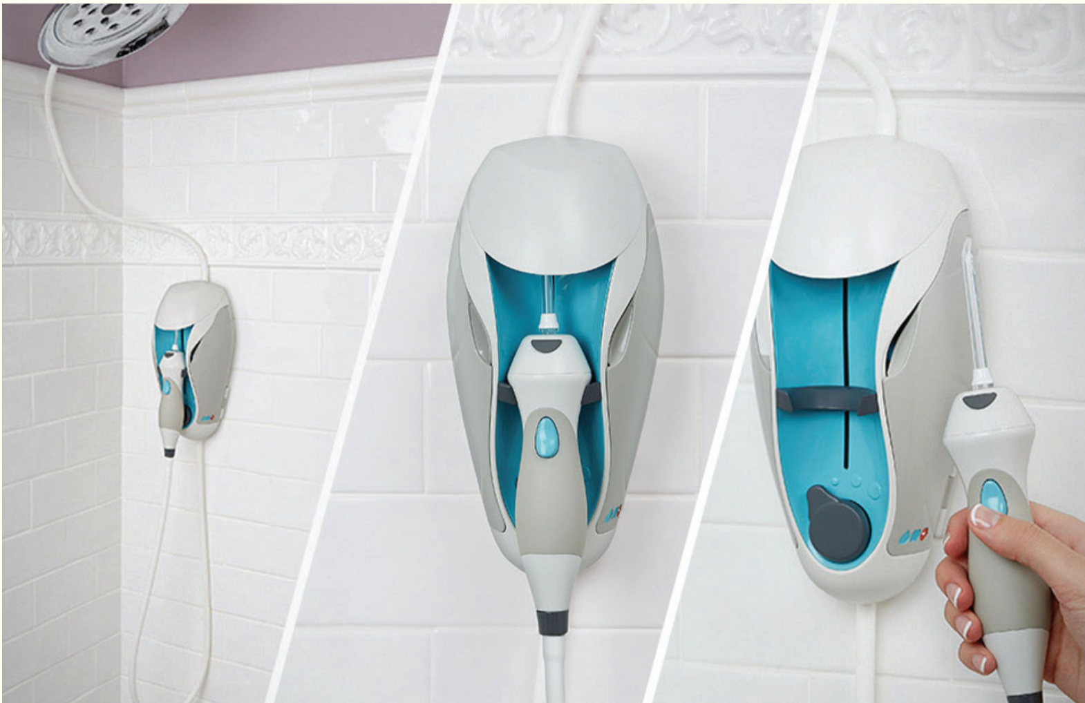
ToothShower je naprava za kućnu oralnu brigu koja ne koristi nikakvu struju osim snage vodenog pritiska u tušu i tako pomaže procesu boljeg čišćenja zuba.

LEIPZIG, Njemačka: Ovo je prvi dio skupnog finansiranja Dental Tribune International-a (DTI-a) koji pokazuje najnovije i najveće ideje u oblasti dentalne brige nagovještavajući šta i ko će predvoditi narednu dentalnu revoluciju. Tehnologija je često veoma važan izvor informacija, a načini na koje možemo poboljšati oralnu brigu kod kuće su joj glavni fokus. Sa obzirom na to da je većina dentalnih problema preventabilna, pametno čišćenje zuba je nešto što inovatori žele naročito promovisati.