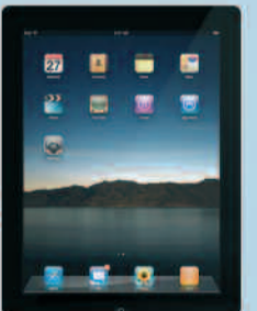
Wi-Fi 16 Go

* Règlement consultable sur www.cleankeys.fr