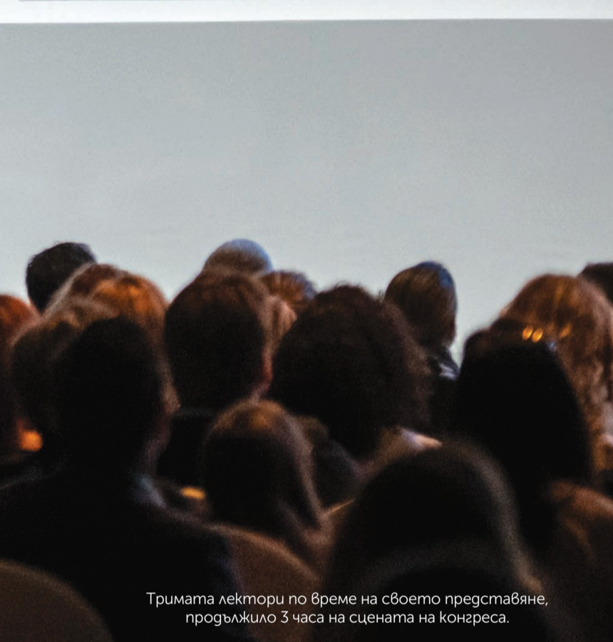
Тримата лектори по време на своето представяне, продължило 3 часа на сцената на конгреса.

бета-тестването на софтуера и изнесохме първите си лекции пред зъболекари и зъботехници, първите, които презърнаха идеята, бяха зъботехниците, понеже програмата значително улесни работата им. Вместо да губят часове в скулптиране и оформяне на восъчния моделаж на вах-ур-а, без да имат цялата нужна информация, с помощта на Rebel те имат готов дигитален вах-ур за секунди. Разбира се, ако сметнат за нужно, могат направят някои промени. В лекцията си демонстрирах колко лесно и точно всички детайли по текстурата, формата и детайлите на възстановяванията могат да бъдат принтирани или фрезовани на CAD/CAM апарат, за да бъдат тествани в устата на пациента, преди да започнем с каквото и да било препариране на зъбите.