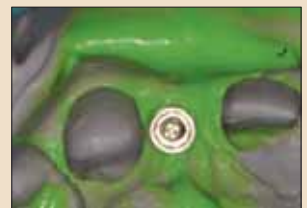
图6：印模帽在硅橡胶内。