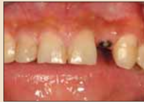
图1：种植体平台暴露。

贺利氏幻时Variotime硅橡胶在凝固前具有良好的流动性与可塑性，凝固后具有良好的弹性、韧性和强度，制取的印模精确度高，非常适用于种植修复的应用。DT