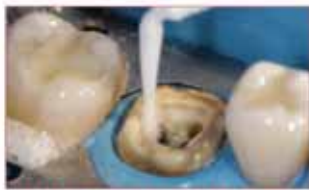
D.T. LIGHT-POST® ILLUSION® X-RO® 放置变色纤维桩