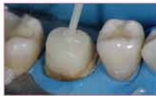
轻松使用 CORE-FLO® DC 修复核