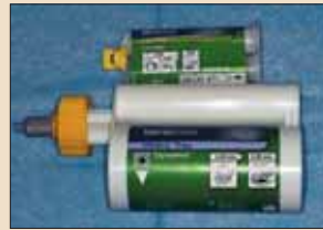
图2：贺利氏幻时Variotime硅橡胶。