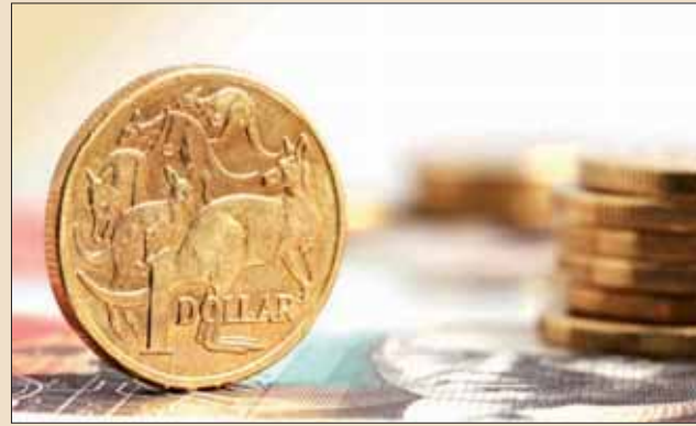
澳大利亚国内牙科设备的销量较去年下滑

他表示近期市场滑落很大程度上能够归咎于2009-2010财年的强劲增长，这段时期，澳大利亚政府为应对全球金融危机而提供了减税政策。