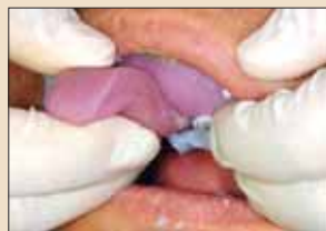
图4：托盘放入口内就位。