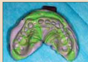
图5：口内固化2.5min后取出。