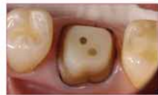
核修复树脂强度与牙本质相似，可立刻 进行牙体预备。 BISCO 粘结剂可保证长 期粘结稳定。