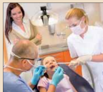
专家相信，橡胶手套造成接触性过敏

专家总结，由手套引起的接触性过敏是一个持续增长的问题，并且不容忽视。Paping表示：“拥有全球1500亿的年使用量，医用手套需要特别关注。”他警告：“在这种情况下，你的职业生涯可能受到威胁。” DT