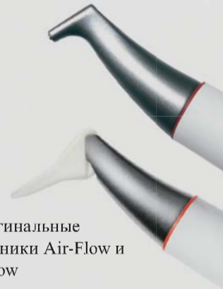
> Оригинальные наконечники Air-Flow и Perio-Flow

Эффективное удаление биопленки в глубоких пародонтальных карманах. Это сущность Оригинальной Технологии Air-Flow Perio. Сокращение уровня поддесневых бактерий предотвращает потерю зуба (пародонтит) или потерю имплантата (периимплантит). Равномерный турбулентный поток воздушно-порошковой смеси и воды предотвращает эмфизему мягких тканей, даже за пределами традиционной области профилактики, благодаря действию носика Perio-Flow.