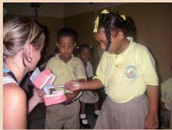
Instruktionen der korrekten Zahnputztechnik, Escuela La Romana.

In der Schweiz bildet die Schulzahnpflege die wichtigste Grundlage für die zahnmedizinische Betreuung von Kindern und Jugendlichen. Als Dentalhygienikerin und Schulzahnpflegeinstructorin (SZPI) setze ich mich täglich für die Mundgesundheit unserer Jugend ein. Ich finde es grossartig, dass unsere „Kleinen“ heutzutage die Chance haben, ohne Karies oder Gingivitis aufzuwachsen. Leider haben weltweit nicht alle Kinder dieses Glück, vor allem in ärmeren Ländern hinkt vieles hinterher.