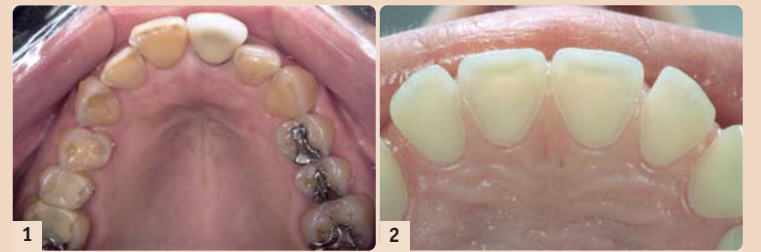
Abb. 1: Oberkiefer eines 29-jährigen Mannes (!) mit einer jahrelangen Essstörung. – Abb. 2: Das Bild zeigt eine ca. 25-jährige Frau mit massiven Substanzverlusten an den Palatinalflächen am Oberkiefer, sodass bereits die Pulpa rosa durchscheint.

Die Bulimie wurde erst 1980 in der amerikanischen psychiatrischen Nomenklatur (DSM-III) als eigenständige Krankheit beschrieben und hat später auch Eingang in die ICD-10 gefunden ( Tabelle 1 ). Seither ist eine rapide Zu-