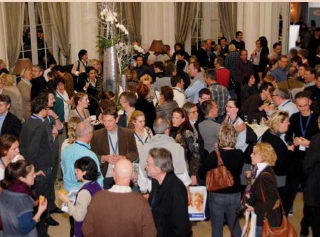
SVK Kongress 2012 mit Rekordbeteiligung

Rennes (FR), präsentierte die elektronische Anästhesie Quicksleeper, welche mittels einer rotierenden Nadel den Knochen durchstechen lässt und das Anästhetikum im Knocheninneren verteilt. Dazu wird erst eine Voranästhesie benötigt, danach kann mit dem Gerät, welches durch ein Funk-Fusspedal bedient wird und eine rotierende Nadel besitzt, gezielt die äussere Knochenschicht durchbohrt werden, um dann mit elektronisch gesteuertem Druck ins Knocheninnere zu injizieren. Mit dem Quicksleeper lassen sich verschiedene Blockanästhesien im Ober- und Unterkiefer realisieren, welche alle durch Prof. Sixou vorgestellt wurden. Im Unterkiefer können so bis zu vier Zähne auf beiden Seiten der Einstichstelle mit Anästhetikum erreicht werden, in Verwendung von nur einer halben Ampulle.