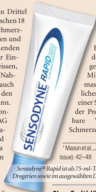
Sensodyne® Rapid ist als 75-ml-Tube in Apotheken und Drogerien sowie im ausgewählten Detailhandel erhältlich.

GlaxoSmithKline Consumer Healthcare AG hat sich dieser Thematik angenommen und mit der Zahnpasta Sensodyne® Rapid ein Produkt entwickelt, das die Schmerzempfindlichkeit von Zähnen in nur 60 Sekunden lindert und bei zweimal täglichem Zähneputzen einen lang anhaltenden Schutz bietet. Die Strontiumacetat-Formel der Zahnpasta bildet eine tiefe und säurestabile Okklusionsbarriere, die die offenen