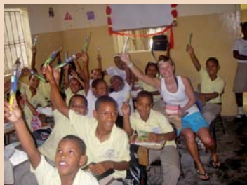
Escuela La Romana: Die jüngsten Kinder der Schule freuten sich riesig über die neuen Zahnbürsten. Auch die älteren Schüler waren sehr aufmerksam und hatten Spass an meiner „Zahnputz-Lektion“.

sprachen mir ihre Dankbarkeit aus und äusserten den Wunsch, weiterhin solche Instruktionen zu erhalten.