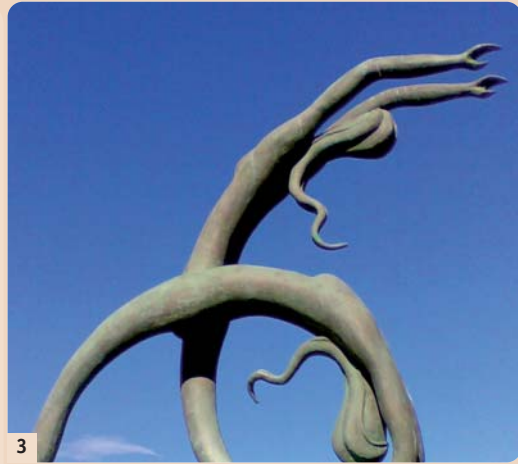
Das weibliche Schlankheitsideal künstlerisch dargestellt. (Skulptur: Hafenpromenade in Heraklion, Kreta.)

sind die meisten Bulimiepatientinnen gut ausgebildete und pflichtbewusste Frauen. Sie neigen dazu, sich in Beziehungen übermässig anzupassen und unterzuordnen. Bulimiekranken hegen nicht nur bezüglich Körpergewicht und Aussehen sehr hohe Erwartungen an sich selbst, sondern auch bezüglich ihrer Leistungen in anderen Lebensbereichen. Hintergrund für die erwähnten Störungen bildet meist eine Kindheitskonstellation, wie sie von der Psychoanalytikerin Alice Miller treffend als „Drama des begabten Kindes“ beschrieben worden war: 5 Sie fühlten sich als Kinder nicht richtig geliebt und kämpften dauernd um die Anerkennung der Eltern. Vor allem hofften sie, aufgrund von guten Leistungen und der Erfüllung aller Erwartungen der Eltern von diesen Zuwendung zu erhalten, was ihnen aber nie richtig gelingen konnte. Oft liegen schwere Selbstwert- und Beziehungsstörungen (z.B. Borderlinestörung) als Folge psychischer Traumatisierungen (Missbrauch) vor.