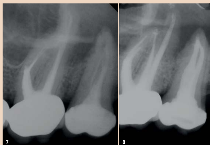
Abb. 7: Zahn 26 mit Instrumentenfragment, Stufenbildung mesial und Gefahr der Perforation, Zahn 27 mit insuffizienter Wurzelfüllung und inseriertem Stift. – Abb. 8: Zahn 26 Zustand nach Revision, Fragmententfernung, Stufenentfernung; Single-Visit-Behandlung, Zahn 27 Zustand nach Revision, Stiftentfernung und Wurzelfüllung, zweizeitiges Vorgehen.

In den Dentintubuli als ein weiterer Bereich der Bakterienkolonisation wurden in der Gruppe II (zweizeitig) keine Mikroorganismen um die Hauptkanäle im mittleren und apikalen Drittel herum gefunden. Im Vergleich hierzu gab es in fünf von sechs Fällen der Gruppe I (einzeitig) histologisch positive Befunde. Nicht erfasst wurde durch die Studie die Quantität der Mikroorganismen. Zudem lässt die Fallzahl (Gruppe I: n = 6, Gruppe II: n = 7) keine allgemeingültigen Aussagen zu. Peters et al. zeigten in ihrer Studie zur Wirksamkeit von Spüllösungen und medikamentösen Einlagen, dass die in den Dentintubuli befindlichen Bakterien aufgrund ihrer relativ geringen Anzahl weitestgehend keinen Einfluss auf das Ergebnis der Behandlung nehmen. 11 Offen lässt die In-vitro-Studie, ob die Bakterien innerhalb der Dentintubuli nach erfolgter Obturation aufgrund fehlender Substrate endgültig „verhungern“ oder sich langfristig erneut kolonialisieren und somit pathologische Relevanz erhalten können.