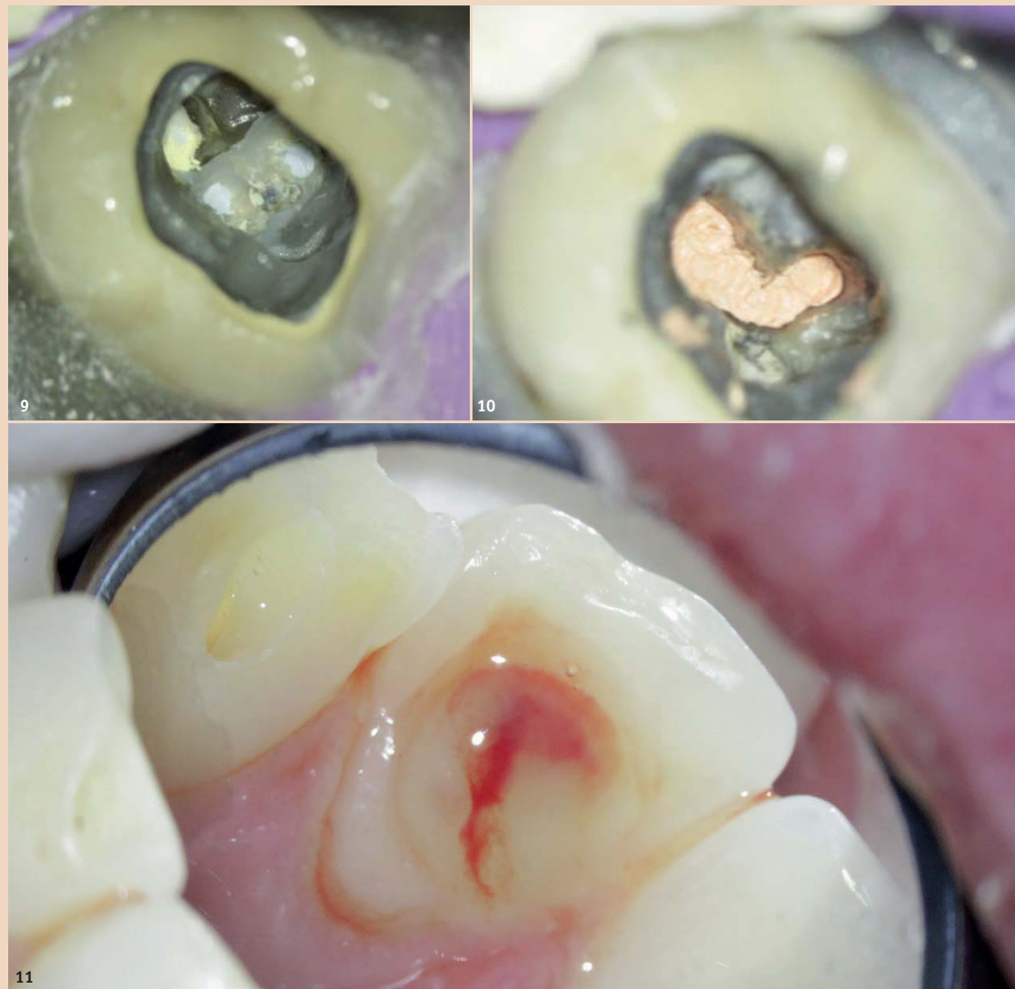
Abb. 9: Zahn 37 Zustand vor Revision. – Abb. 10: Zustand nach Revision und Wurzelfüllung, C-Konfiguration des Wurzelkanalsystems. – Abb. 11: Pus-Austritt bei apikalem Abszess am Zahn 22.

Aufbereiten aller Haupt- und akzessorischer Wurzelkanäle, das Entfernen von Fremdmaterial (z. B. Instrumentenfragmente) und „altem“ Wurzelfüllmaterial sowie eine ausreichend lange Einwirkzeit der Spüllösungen. Für die Entscheidung Single-Visit- oder mehrzeitige Behandlung scheint das Vorhandensein einer apikalen Os-