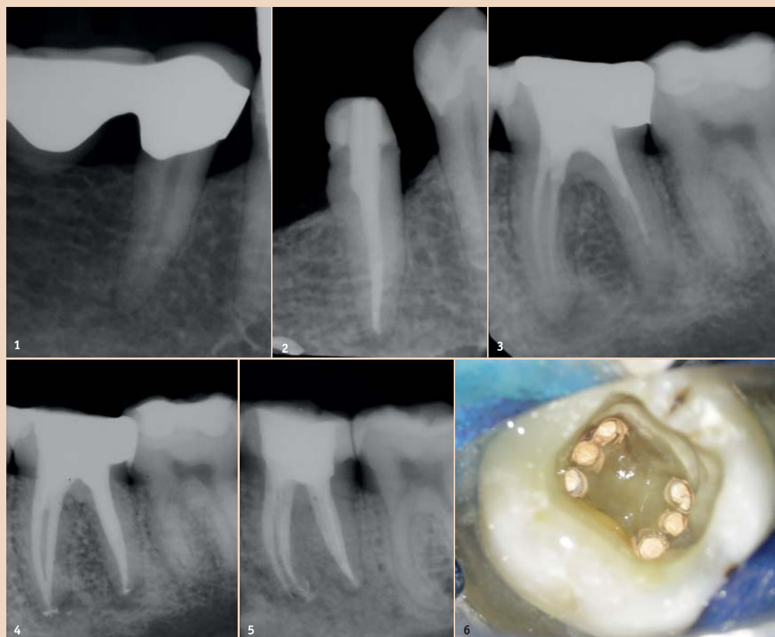
Abb. 1: Akute irreversible Pulpitis an Zahn 45. – Abb. 2: Zustand nach Wurzelfüllung; Single-Visit-Behandlung. – Abb. 3: Zahn 36 mit insuffizienter Wurzelfüllung und apikaler Aufhellung an mesialer und distaler Wurzel. Abb. 4: Zustand nach Wurzelfüllung; Single-Visit-Behandlung. – Abb. 5: Zahn 36 mit sechs Wurzelkanälen; Zustand nach Wurzelfüllung. – Abb. 6: Zahn 36 intraoperative Situation nach Wurzelfüllung.

ren eingesetzt wurde. Der Parodontalspalt lässt sich durchgängig nachverfolgen. Sie stellen die Diagnose: „Irreversible Pulpitis“ und leiten die Wurzelkanalbehandlung ein. Praktischerweise hat kurz zuvor die eigentlich stattfindende Behandlungssitzung von zwei Stunden abgesagt und der Patient willigt in die Behandlung ein. Die Möglichkeit, die endodontische Therapie in nur einer Sitzung abzuschließen, steht Ihnen theoretisch nun offen. Und wie verhält es sich im