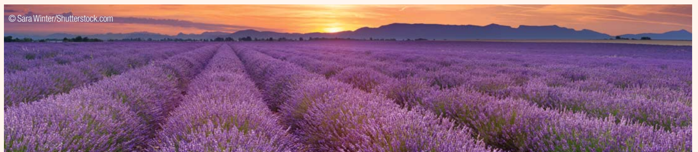
Fig. 1 : Champ de Lavande fine.

Les propriétés découlent de la présence des différents types de principes actifs répertoriés.