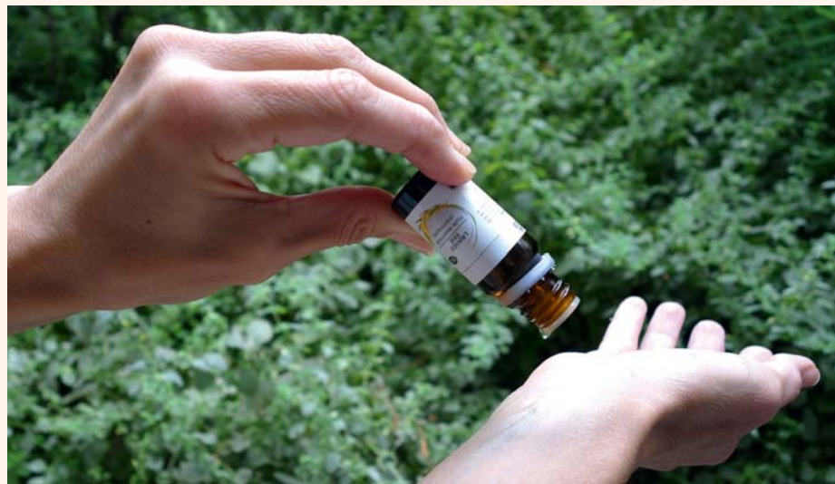
Fig. 2 : Pratique : Application aisée de 1 à 2 gouttes d'huile essentielle de Lavande fine, au niveau du poignet pour une efficacité quasi-immédiate relaxante ressentie.

Cette médication d'aromathérapie est un remède d'action prouvée sur le système nerveux, et, particulièrement utile avant tout rendez-