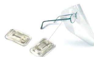
CLIPON POUR LUNETTES

POLYDENTIA SA Swiss Products for Fine Dentistry