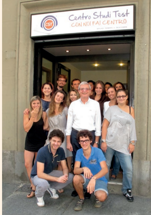
Alcuni "candidati" all'ammissione alle Facoltà a numero chiuso con il titolare del Centro Studi Test di Torino.

gazzi in Italia parteciperanno nel prossimo settembre alle prove di ammissione alle Facoltà a nume-